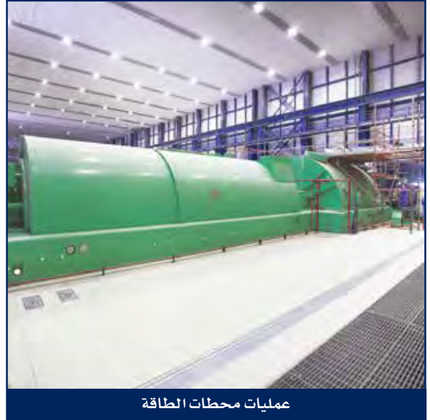
عمليات محطات الطاقة

من خلال الخبرة الكبيرة في تشغيل وصيانة محطات الطاقة وتوفر أسطول متنوع من المعدات تقوم هايسكو بإنجاز كافة أعمال الصيانة لمحطات الطاقة في موقعها، وتشمل هذه العمليات على خدمات متنوعة مثل عمليات الإغلاق الرئيسية للسخانات وعمليات التنظيف الكيميائي وإعادة إعمار التوربينات البخارية والغازية وتحسين أداء الإحتراق للسخانات، وتوفير الخدمات الميكانيكية والكهربائية والأجهزة الدقيقة وأجهزة التحكم وصيانة وحدات تقطير المياه ومحطات إعادة الكرىنة، ومحطات ضخ الوقود وضواغط الهواء والمضخات ومرافق تقطير المياه ومرافق مأخذ المياه ومرافق التهوية ودفع الهواء، وصيانة وإعادة تغليف أنابيب المبادلات الحرارية ذات النوع الصدفي والأنبوبي واللوحى والمبردات المروحية والمكثفات ومبردات الهواء وخلافه، وتغطي خدماتنا كافة الجوانب والأنشطة الضرورية لتشغيل محطات الطاقة بطريقة آمنة وفعالة ومعتمدة وبأفضل الأساليب الاقتصادية.