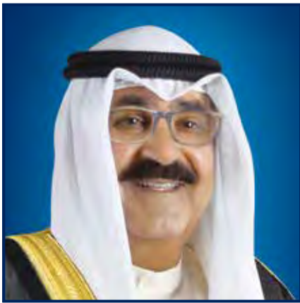
صاحب السمو ولي العهد الأمين الشيخ / مشعل الأحمد الجابر الصباح