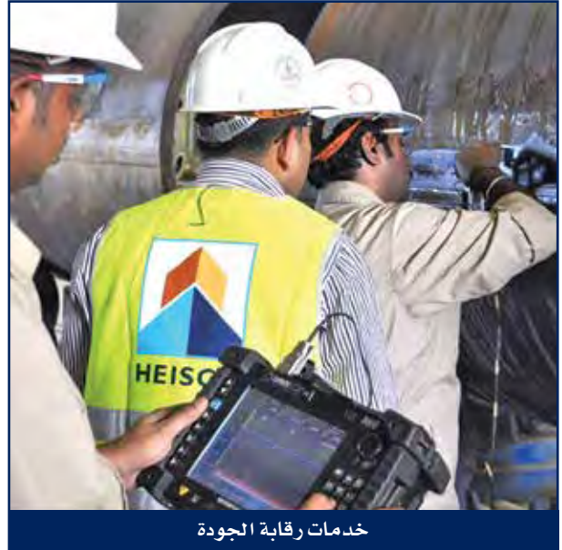
خدمات رقابة الجودة

ضماناً لتحقيق الإلتزامات التعاقدية الفنية والقانونية ومتطلبات السلامة المهنية، تقوم إدارة ضبط الجودة لدى هايسكو بأعمال الفحص وفقاً لأنظمة الجودة العالمية، ومعتمدة طبقاً لمعايير آيزو (9001:2015) وفقاً للمواصفات القياسية العالمية (API – Q1).