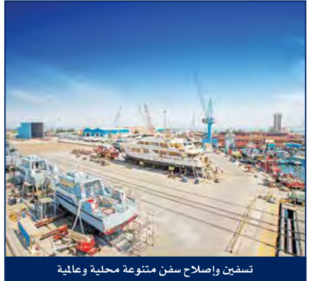
تسفين وإصلاح سفن متنوعة محلية وعالمية