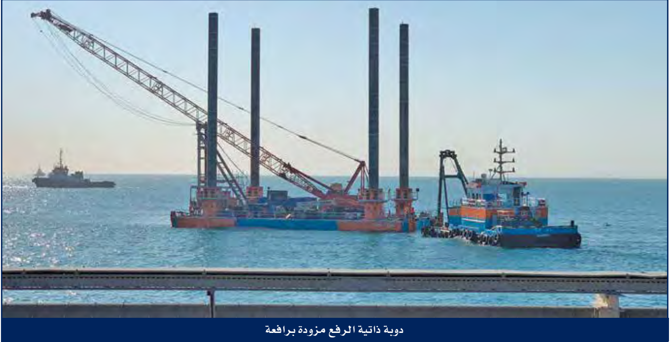
دوية ذاتية الرفع مزودة برافعة