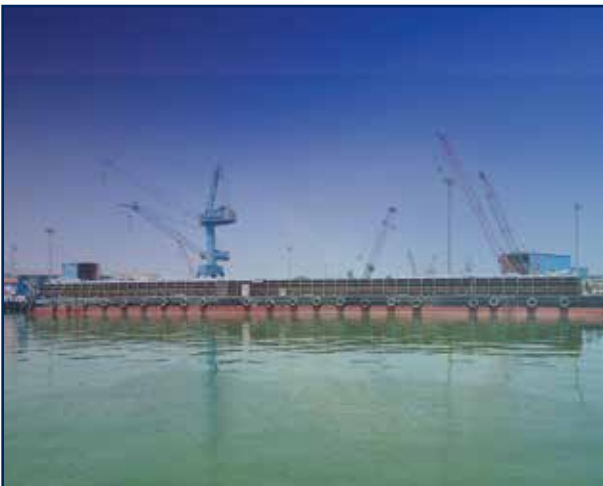
دوية نقل الصخور