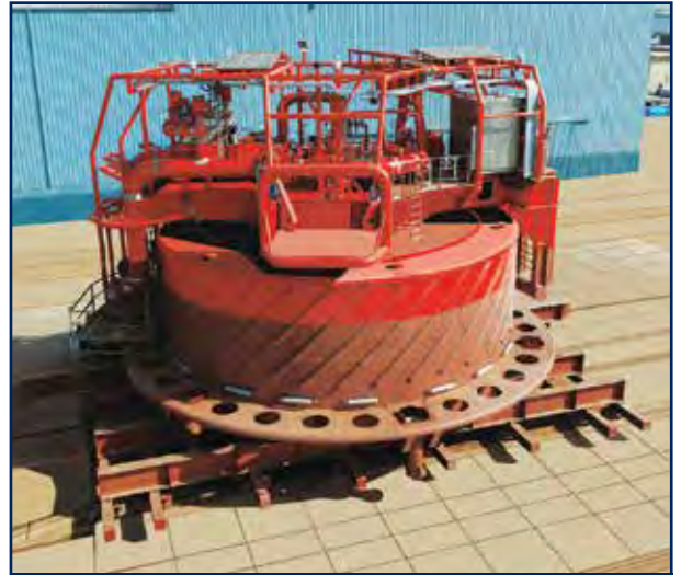
أعمال بناء مرسى رحوي من تصميم شركة بلو ووتر إنرجي سرفيسز بي في (الهولندية) لصالح شركة نفط الكويت