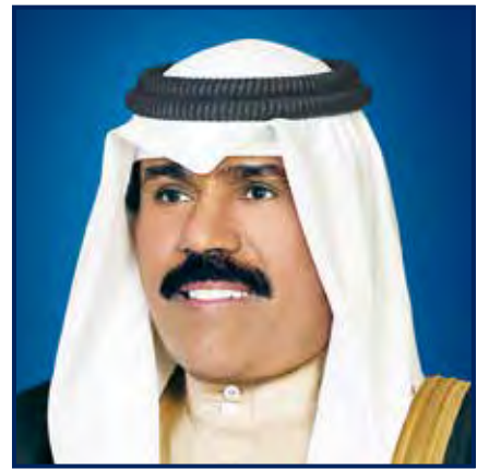
صاحب السمو أمير دولة الكويت الشيخ / نواف الأحمد الجابر الصباح