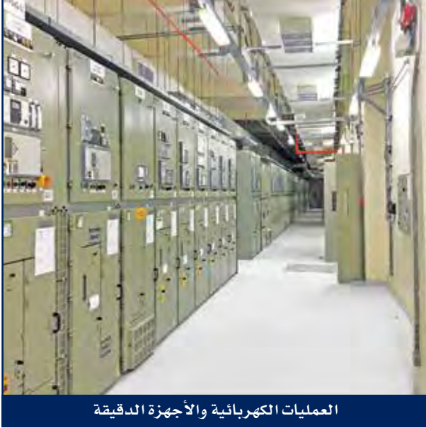
العمليات الكهربائية والأجهزة الدقيقة

والآلات الأكثر تطوراً. ولديها خبرة كبيرة في المشاريع الإنشائية الكبرى الخاصة بالأعمال الكهربائية والأجهزة الدقيقة ومجال الإتصالات وأنظمة الحماية الكاثودية.