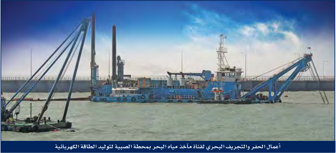
أعمال الحفر والتجريف البحري لقناة مأخذ مياه البحر بمحطة الصبية لتوليد الطاقة الكهربائية