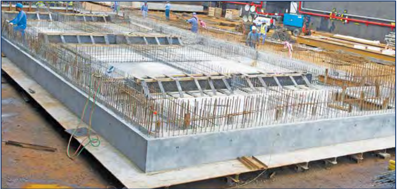
تصنيع عائمة من الخرسانة المسلحة