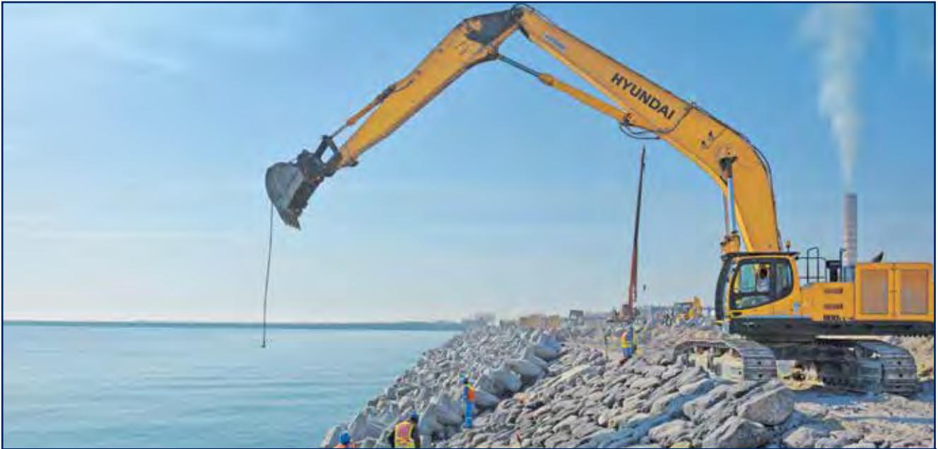
أعمال تركيب الصخور لحماية الشاطئ