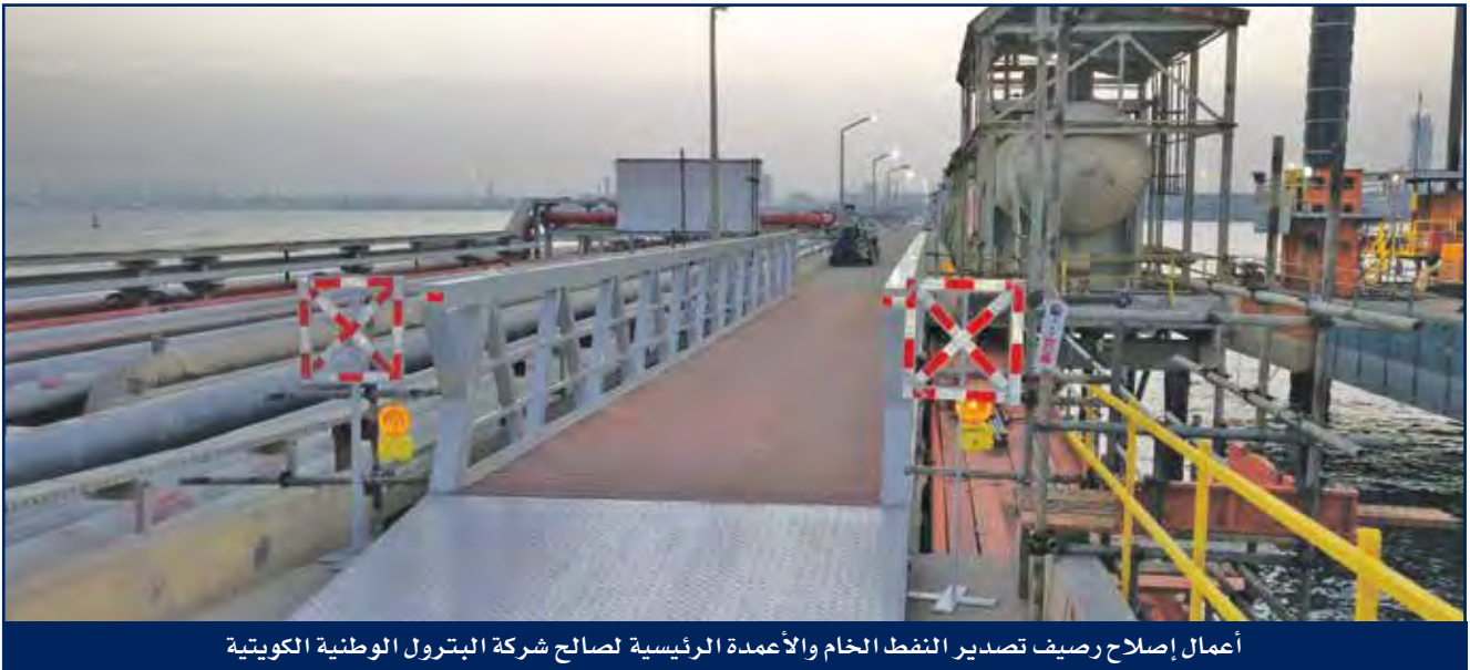
أعمال إصلاح رصيف تصدير النفط الخام والأعمدة الرئيسية لصالح شركة البترول الوطنية الكويتية