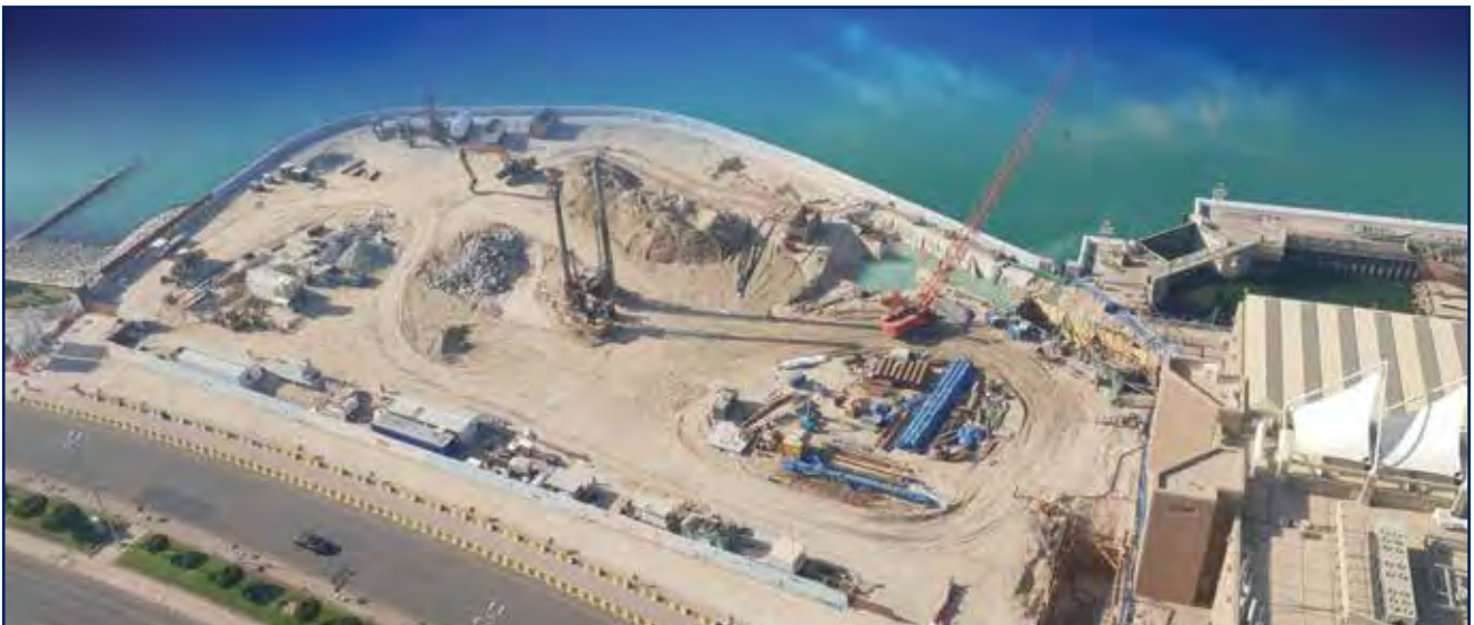
مشروع برنامج توسعة المركز العلمي الكويتي حزمة 1 (الأعمال التحضيرية والبحرية) لصالح مؤسسة الكويت للتقدم العلمي