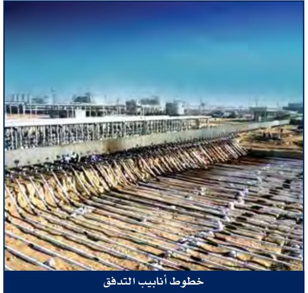
خطوط أنابيب التدفق

تتضمن الخدمات إدارة المشروع والإنشاء وتجهيز الموقع وإقامة المرافق المؤقتة وأعمال الإنشاءات المدنية وتصنيع الأنابيب والهياكل الإنشائية وأعمال الإنشاءات الميكانيكية والأعمال الكهربائية والأجهزة الدقيقة والتشغيل والتركيب والمساعدة الفنية وخلافه.