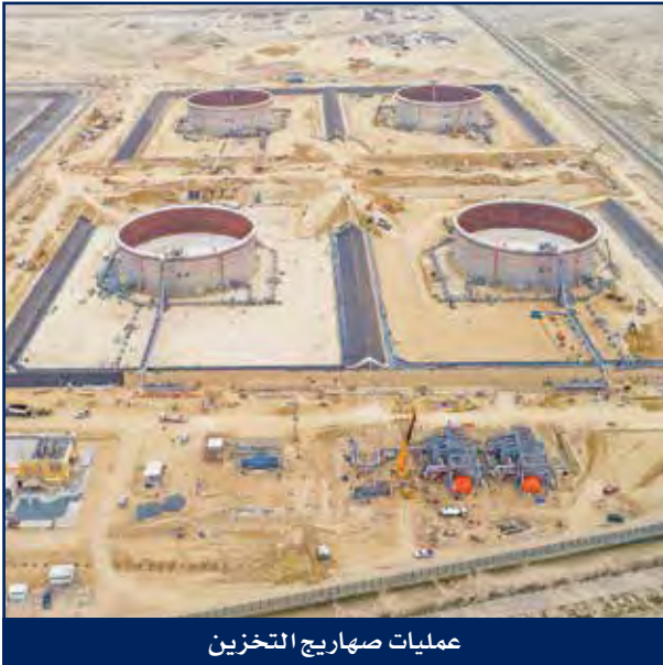
عمليات صهاريج التخزين

من خلال الخبرة الناجحة الممتدة منذ عشرات السنين في مجال تصنيع وتركيب صهاريج التخزين، فإن هايسكو مؤهلة لأعمال الهندسة والتوريد والإنشاء لصهاريج التخزين ذات القطر الكبير بما فيها الأعمال الداخلية المعقدة وأعمال الهياكل وتشمل كذلك التصاميم الداخلية وتركيب المتقن بمواقع المشاريع.