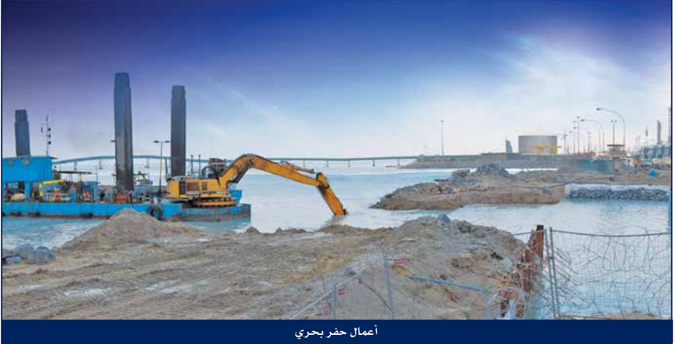
أعمال حفر بحري

بعد تطبيق برنامج الخصخصة من قبل الحكومة الكويتية، أصبحت شركة الخليج تابعة لشركة الصناعات الهندسية الثقيلة وبناء السفن ش.م.ك (عامه) هايسكو.