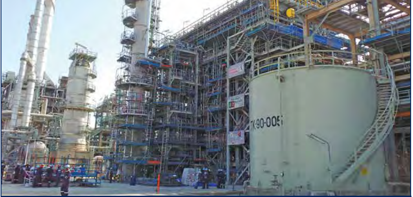
عمليات النفط والغاز