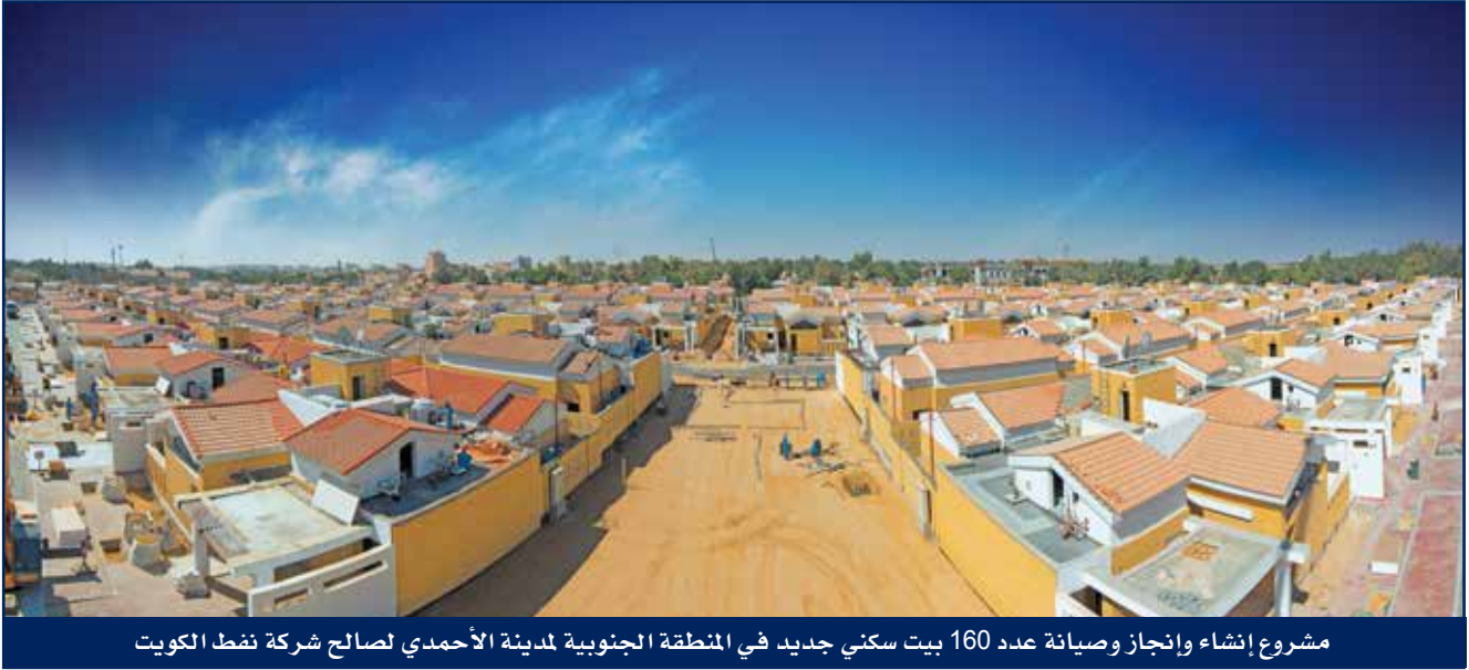
مشروع إنشاء وإتجاز وصيانة عدد 160 بيت سكني جديد في المنطقة الجنوبية لمدينة الأحمدى لصالح شركة نفط الكويت