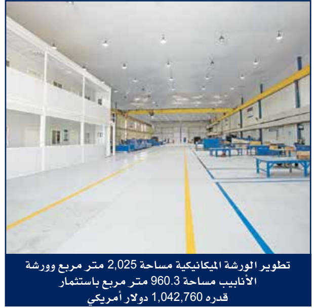
تطوير الورشة الميكانيكية مساحة 2,025 متر مربع وورشة الأنايب مساحة 960.3 متر مربع باستثمار قدره 1,042,760 دولار أمريكي