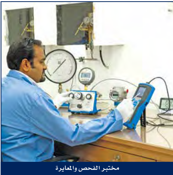
مختبر الفحص والمعايرة

أنشئ مختبر الفحص والمعايرة لدى هايسكو لتوفير خدمات المعايرة الداخلية بصفة خاصة، وتطور المختبر بشكل متسارع لتشمل خدماته أيضاً عملاء الشركة لتوفير خدمات واسعة للفحص والمعايرة في مجالات النفط والغاز والبتروكيماويات والبنية التحتية والكهربائية وقطاعات الطاقة والمياه. ومختبر الفحص والمعايرة لديه القدرة لتوفير شريحة واسعة من الخدمات المنافسة للفحص والمعايرة. ويضم المختبر فريق من المهندسين والفنيين المدربين والمؤهلين بدرجة عالية وأجهزة فحص ومعايرة متطورة ما يمنحه القدرة على توفير خدمات الفحص والمعايرة ذات الجودة والدقة العالية والجديرة بالثقة لمشاريع الشركة أو لعملائها سواء داخل المختبر أو في الموقع وكذلك توفير خدمات الفحص والمعايرة بالإستعانة بأطراف خارجية باستخدام أجهزة متخصصة