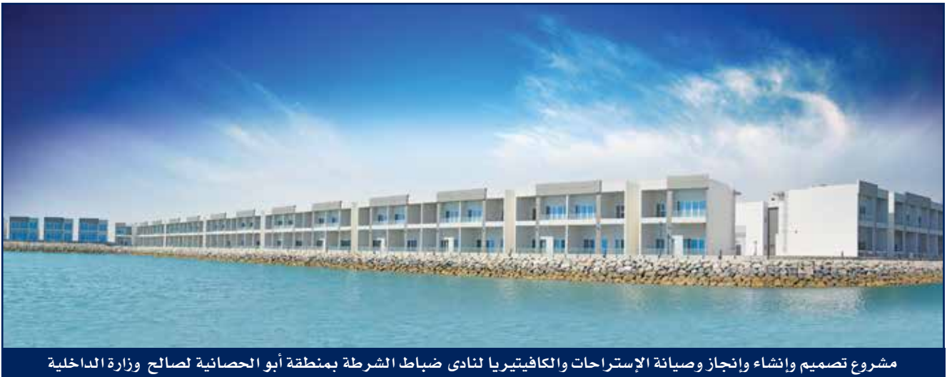
مشروع تصميم وإنشاء وإنجاز وصيانة الإستراحات والكافيتيريا لنادي ضباط الشرطة بمنطقة أبو الحصانية لصالح وزارة الداخلية