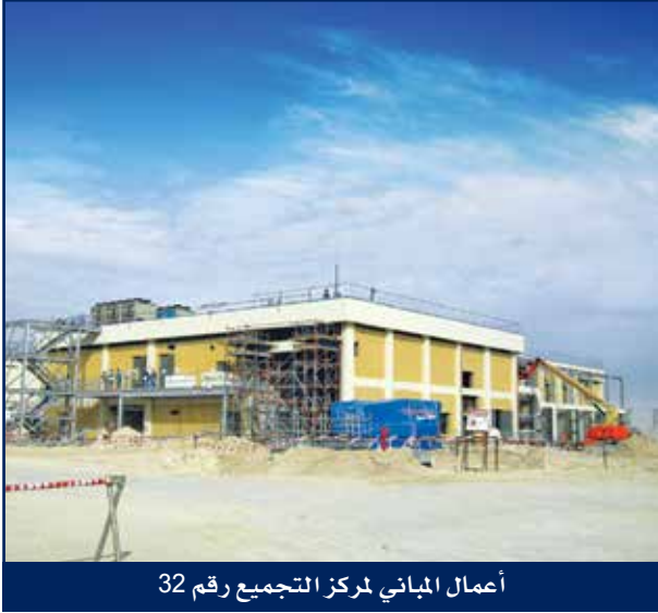
أعمال المباني لمركز التجميع رقم 32