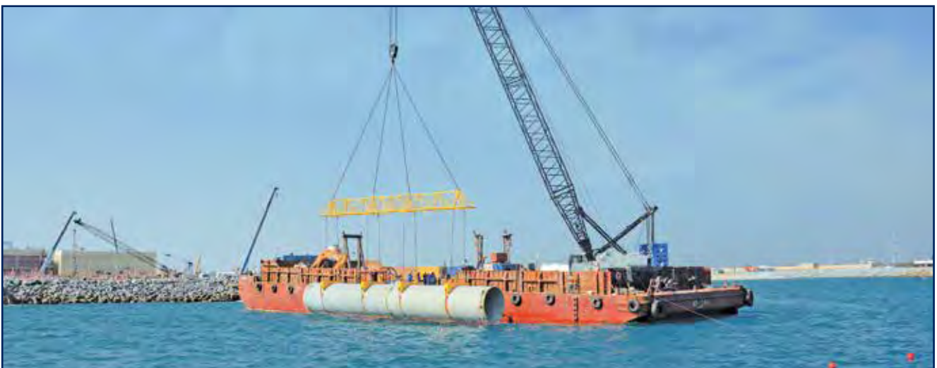
تركيب أنابيب قناة مأخذ مياه البحر