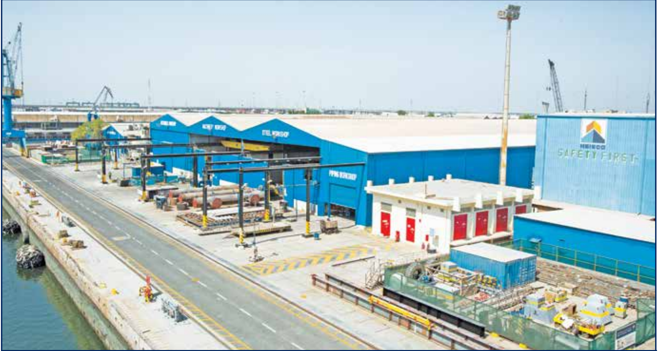
ورش حوض بناء وإصلاح السفن

إن هايسكو كشركة عالمية متخصصة في إصلاح وبناء السفن تهدف لريادة أحواض بناء وإصلاح السفن في الشرق الأوسط من خلال الورش المجهزة بالمعدات والتقنيات الأكثر تطوراً مثل :