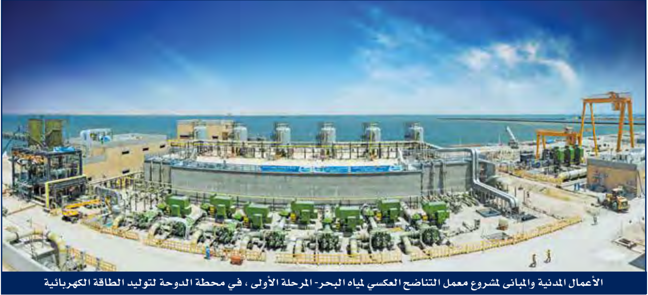
الأعمال المدنية والمباني لمشروع معمل التناضح العكسي لمياه البحر- المرحلة الأولى ، في محطة الدوحة لتوليد الطاقة الكهربائية