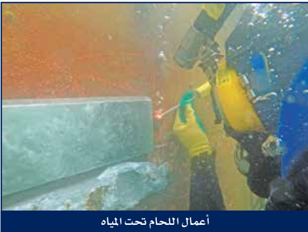
أعمال اللحام تحت المياه