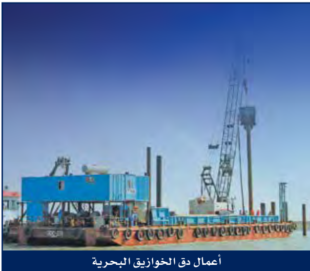
أعمال دق الخوازيق البحرية