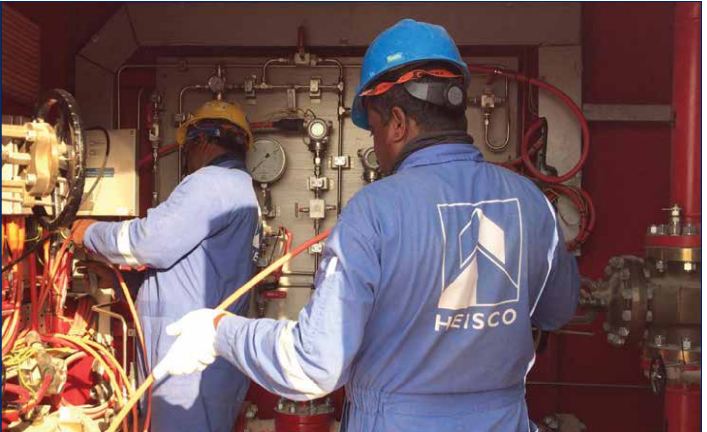
إصلاح وإعادة تأهيل موانع التسريب وقطع الغيار الميكانيكية للوحدات الغازية والدورة المشتركة ووحدات التناضح العكسي بمحطة الزور الجنوبية لتوليد القوى الكهربائية وتقطير المياه