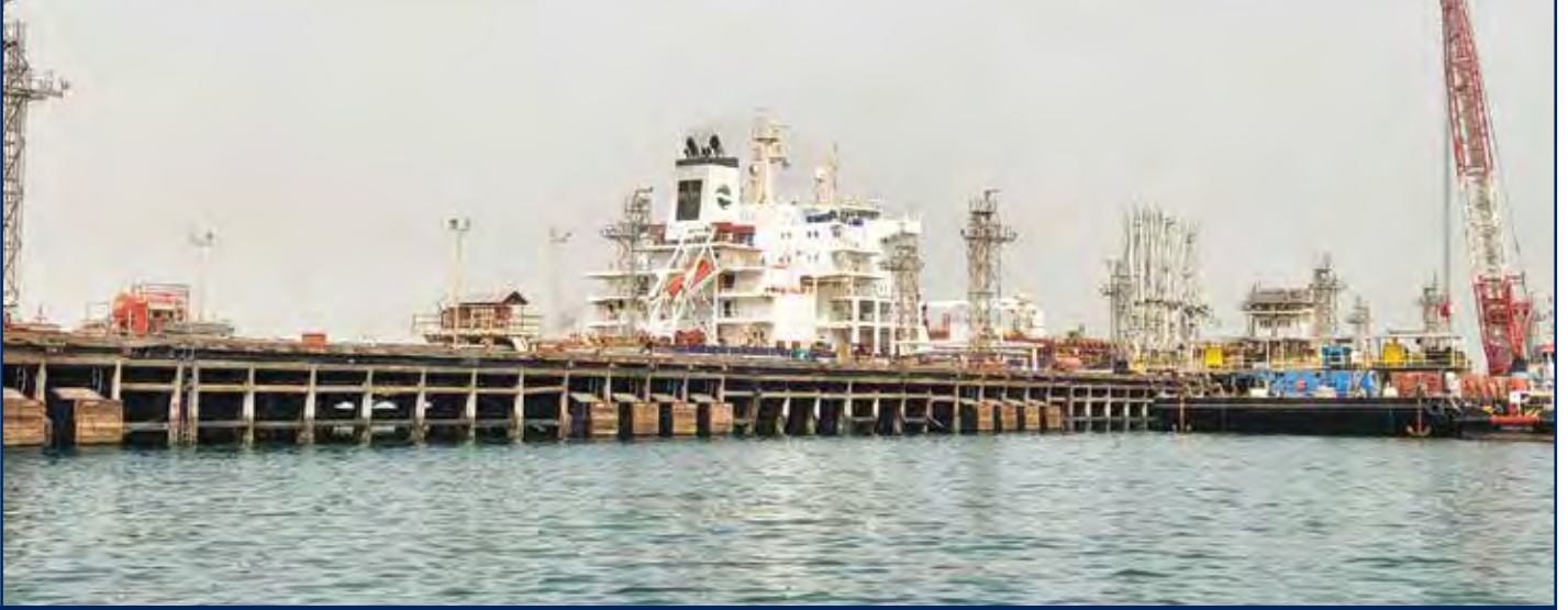
أعمال الصيانة البحرية لمصفاة ميناء الأحمدى