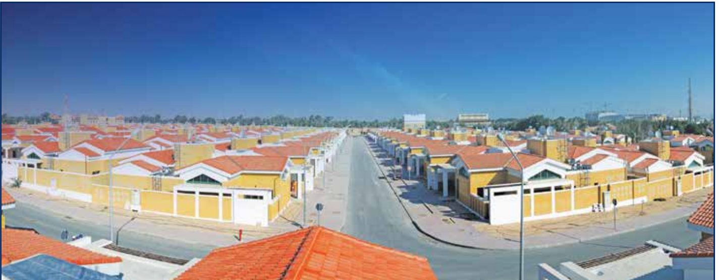
إنشاء وإنجاز وصيانة عدد 160 بيت سكني جديد في المنطقة الجنوبية لمدينة الأحمدى

• مشروع أعمال تطهير وتنظيف الحوض ومقابل الأرصفة لميناء الشعبية لصالح مؤسسة الموانئ الكويتية.