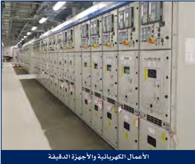
الأعمال الكهربائية والأجهزة الدقيقة

تعد هايسكو شركة رائدة معتمدة في خدمات الهندسة الكهربائية والأجهزة الدقيقة وخدمات الإتصالات وتقوم بتوفير نطاق واسع من هذه الخدمات في مجالات الهندسة والإنشاء والتركيب والمعايرة والاتصالات والصيانة وإصلاح الأعطال والفحص وخدمات ما قبل التشغيل والتشغيل النهائي وتوفير الدعم والحلول الأساسية لأعمال الإنشاء والتشغيل والصيانة لمشاريع النفط والغاز والطاقة في مجال الصناعة.