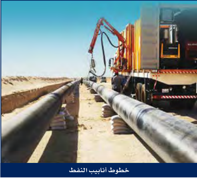
خطوط أنابيب النفط

تفخر هايسكو بما لديها من خبرة واسعة في مجال الهندسة والتوريدات والإنشاءات بمشاريع خطوط الأنابيب في الكويت، وأن التزامها بقواعد السلامة يعد ركن أساسي، ولديها الخبرة في إنشاءات خطوط الأنابيب كبيرة القطر وإنشاء خطوط الأنابيب الطويلة.