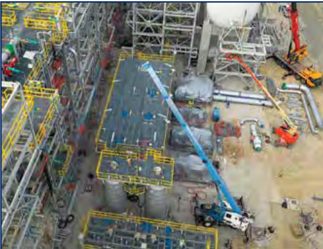
الأعمال الإنشائية والميكانيكية وأعمال الأنابيب والأعمال الكهربائية والأجهزة الدقيقة لمنطقة الكبريت بمشروع مصفاة الزور الجديدة

● الأعمال الميكانيكية وإنشاء الهياكل في الموقع لصالح شركة ايكويت للبتروكيماويات.