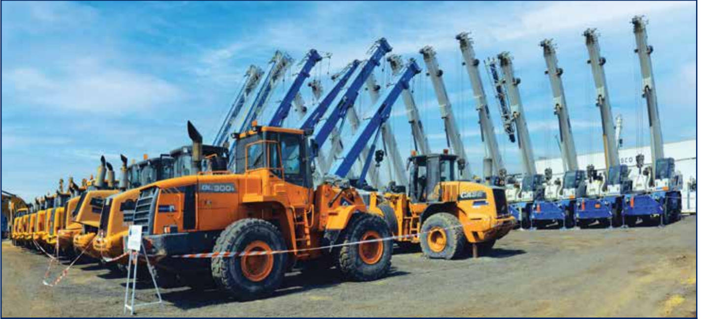
ساحة المعدات الإنشائية