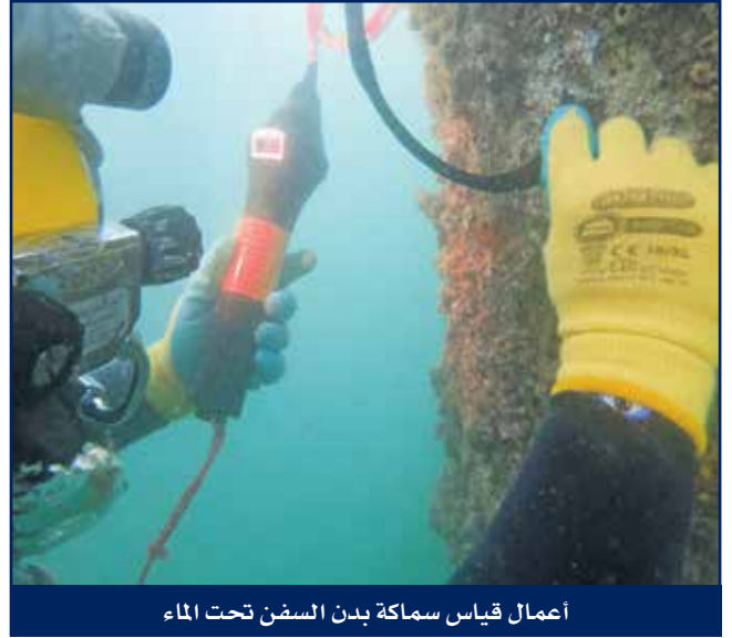
أعمال قياس سماكة بدن السفن تحت الماء