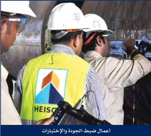
أعمال ضبط الجودة والإختبارات

ضماناً لتحقيق الإلتزامات التعاقدية الفنية والقانونية ومتطلبات السلامة المهنية، تقوم إدارة ضبط الجودة لدى هايسكو بأعمال الفحص وفقاً لأنظمة الجودة العالمية، ومعتمدة طبقاً لمعايير أيزو (9001:2015) وفقاً للمواصفات القياسية العالمية (API - Q1).