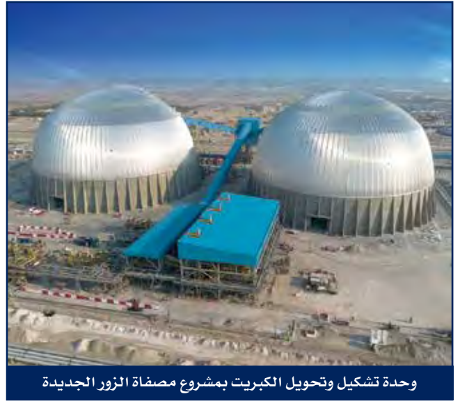
وحدة تشكيل وتحويل الكبريت بمشروع مصفاة الزور الجديدة

● مشروع أعمال التوريدات والإنشاء والتشغيل والصيانة لمشروع تطوير البنية التحتية للتزود بالوقود لمحطة الدوحة الغربية لتوليد القوى الكهربائية لصالح وزارة الكهرباء والماء والطاقة المتجددة.