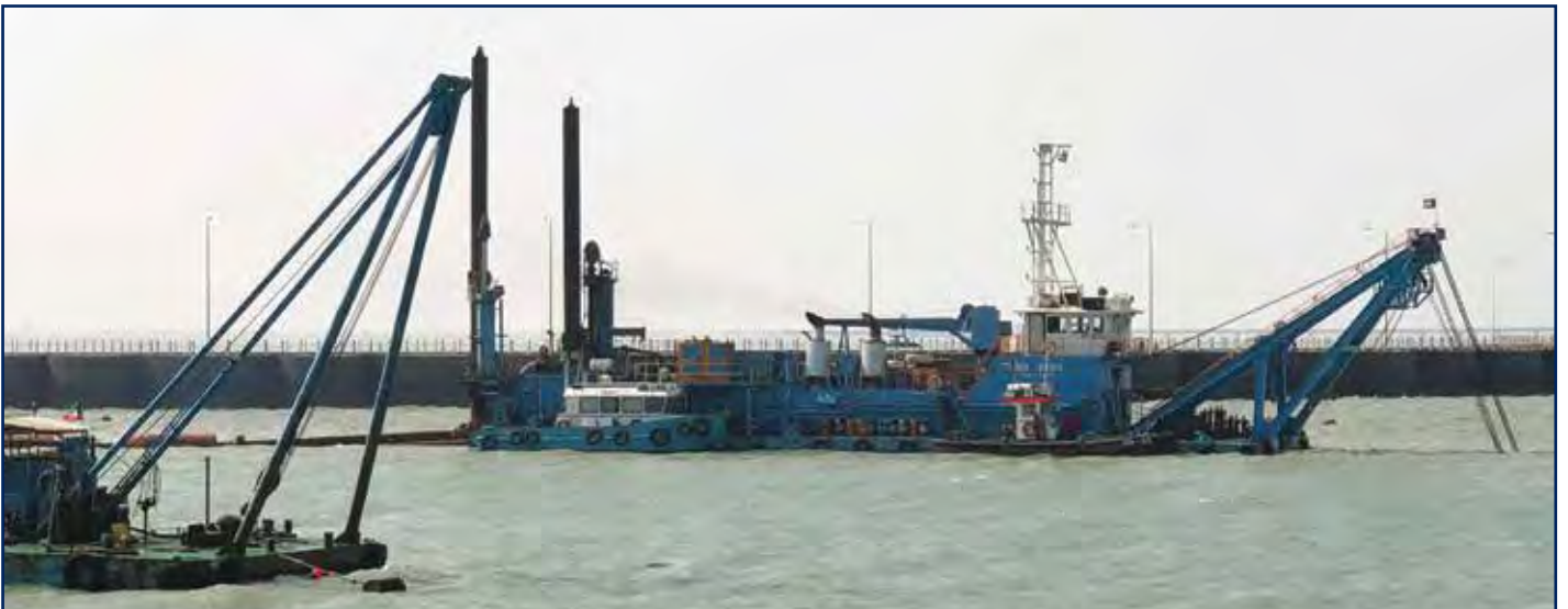
أعمال تطهير قناة مأخذ مياه البحر لمحطة الصبية لتوليد القوى الكهربائية وتقطير المياه