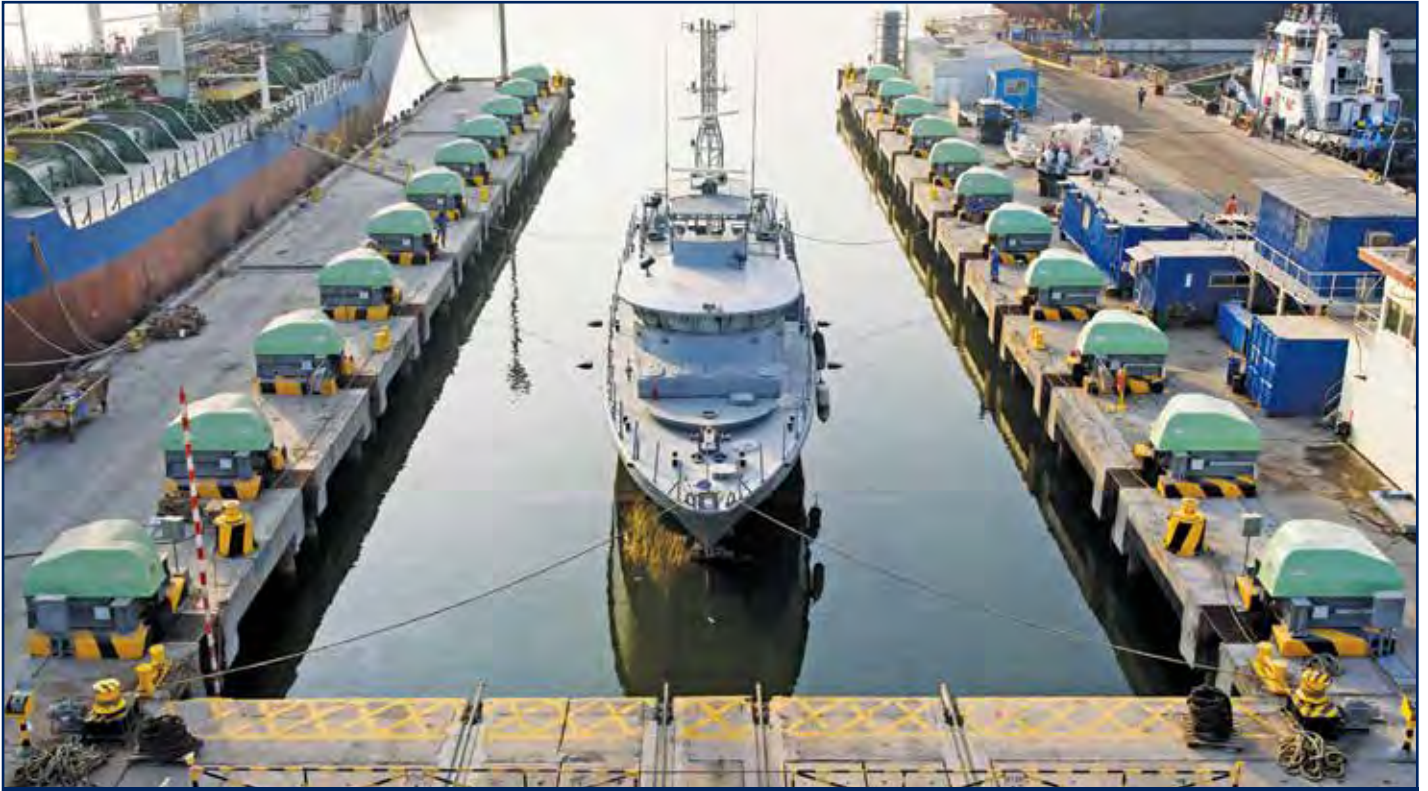
رافعة متزامنة لرفع السفن