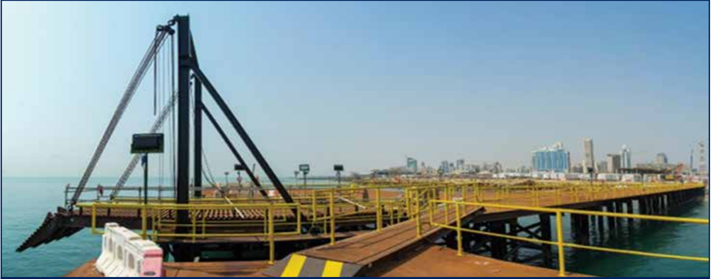
تصميم وإنشاء المرافق الساحلية (المرافق البحرية المؤقتة) بمحطة رأس الأرض اللوجستية