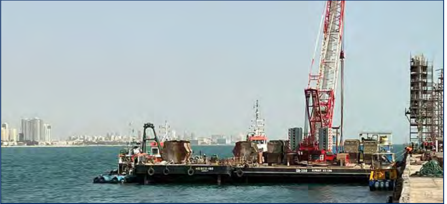
دوية معدات ثقيلة لأعمال الصيانة بمصفاة ميناء الأحمدي