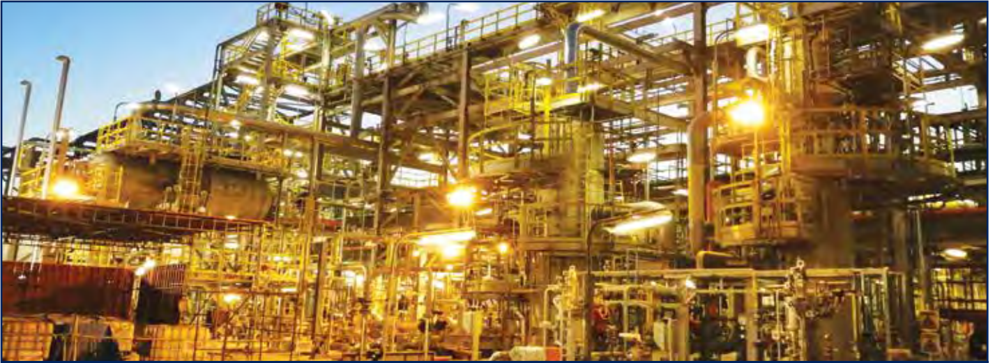
قطاع النفط والغاز

إن نظام إدارة الجودة لهايسكو معتمد وفقاً لمعيار آيزو 9001:2015 ونظام إدارة الصحة والسلامة المهنية معتمد وفقاً لمعيار آيزو 45001:2018 ونظام إدارة البيئة معتمد وفقاً لمعيار آيزو 14001:2015.