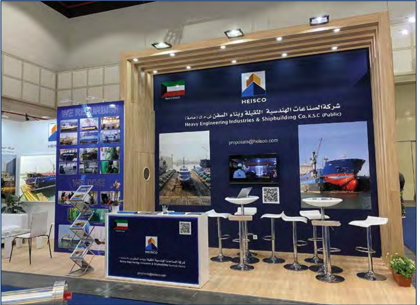
جانب من جناح هايسكو بالمعرض الدولي لبناء السفن والمعدات والتكنولوجيا البحرية - هامبورغ - ألمانيا - 6 - 9 سبتمبر من عام 2022