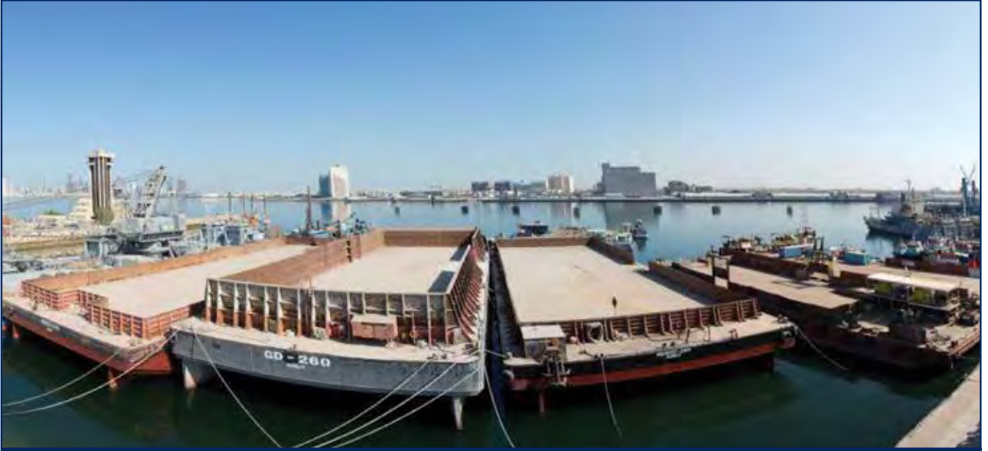
دوب لنقل المواد السائبة