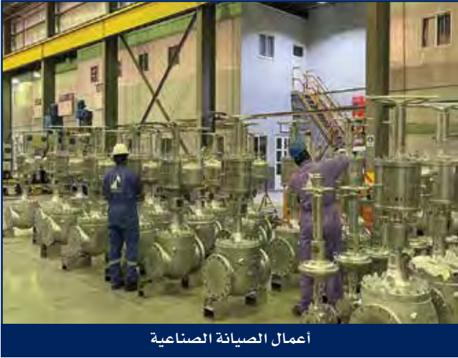
أعمال الصيانة الصناعية

عمليات الصيانة الصناعية لدى هايسكو معروفة كمتعهد رئيسي لتقديم الخدمات ذات القيمة المضافة للعملاء الأساسيين مثل وزارة الكهرباء والماء والطاقة المتجددة وشركة نفط الكويت وشركة البترول الوطنية الكويتية والشركة الكويتية لنفط الخليج وشركة صناعة البتروكيماويات وشركة إيكويت والعمليات المشتركة، وقد اكتسب فريق عمل الصيانة الصناعية خبرة كبيرة ومهارات واحترافية عالية في الخدمات الصناعية المتكاملة وتوفير الدعم والحلول الفنية ذات المقاييس العالية للجودة والسلامة بطريقة التكلفة الفعالة.