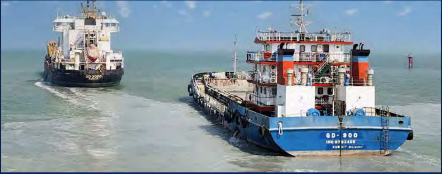
أعمال تطهير وتنظيف القناة الملاحية وأحواض الأرصفة بميناء الشويخ