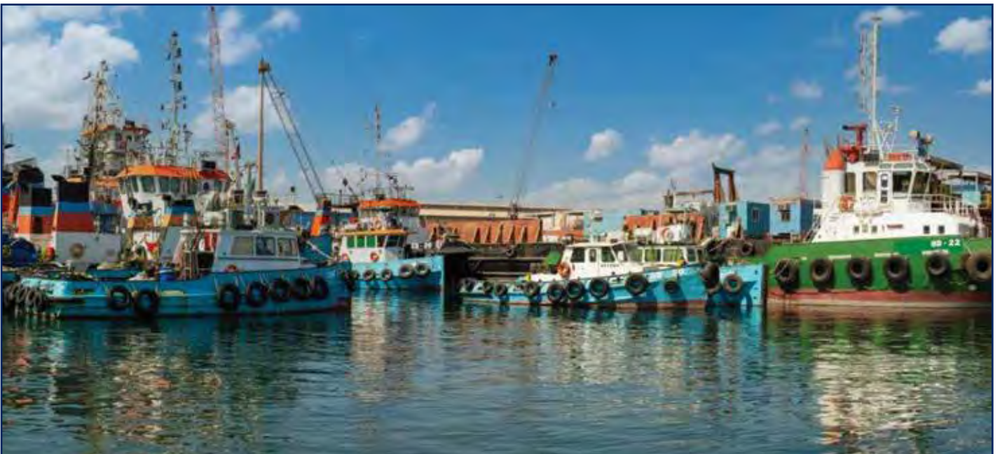
منطقة رسو القطع البحرية بميناء الشويخ