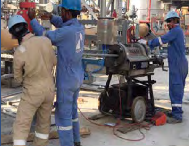
أعمال الصيانة السنوية للمعدات الميكانيكية في محطة الزور الجنوبية لتوليد القوى الكهربائية