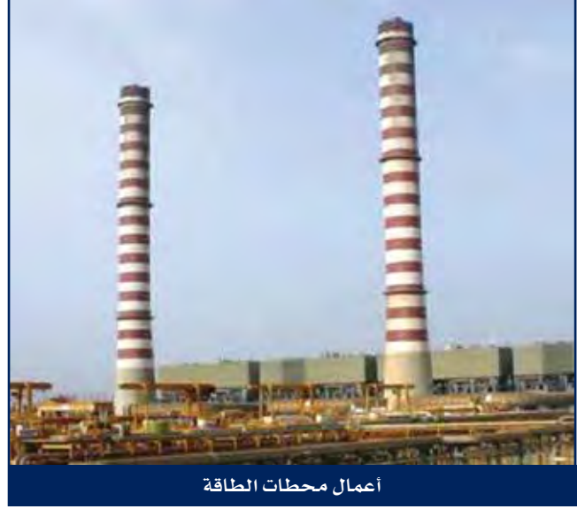
أعمال محطات الطاقة

إن نيل العديد من الجوائز التقديرية التي تلقتها هايسكو و فريق عملها المحترف، ليس الدليل الوحيد على التزام هايسكو بالتميز، وإنما أيضاً إلتزامها لتنمية وزيادة الجودة والفاعلية لوحدات أعمالها الحالية. فهي تعمل باستمرار على تطوير مرافق التصنيع لديها لتوفر لعملائها الخدمات المحسنة.