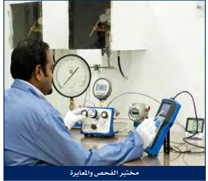
مختبر الفحص والمعايرة

إن السقالات مهمة للغاية في أمور الصيانة والإصلاح إذ لا توجد طريقة أخرى للوصول إلى الإرتفاعات المختلفة بشكل آمن.