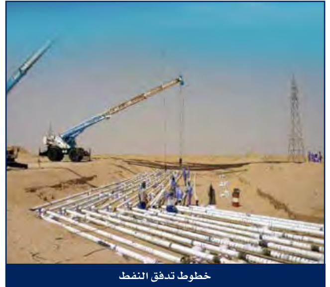
خطوط تدفق النفط