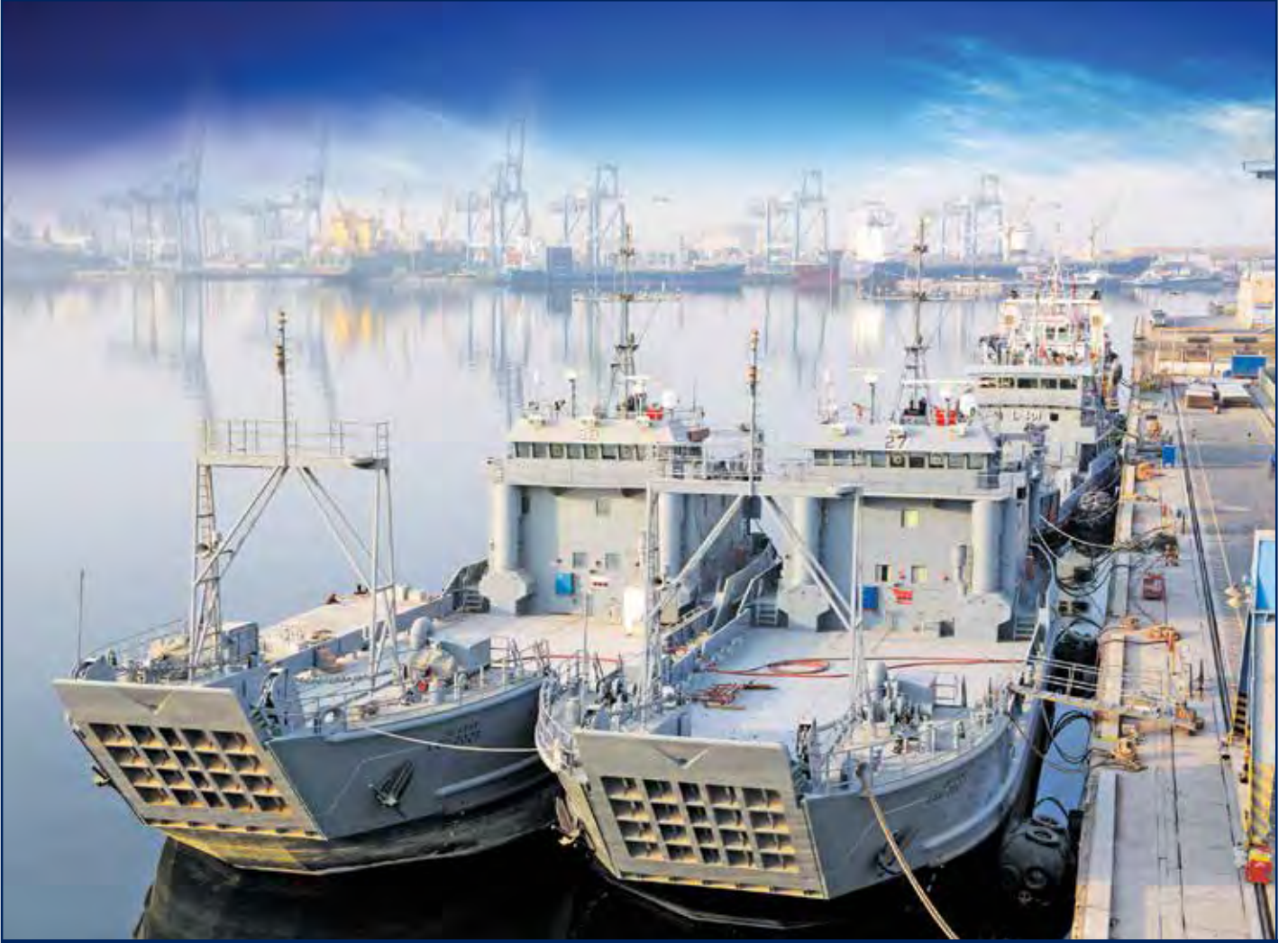
أعمال إصلاح قطع بحرية متنوعة بمحاذاة رصيف الإصلاح