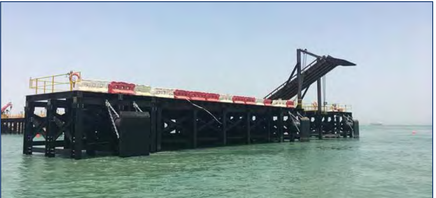
رصيف بحري لتفريغ المواد بمرافق راس الأرض