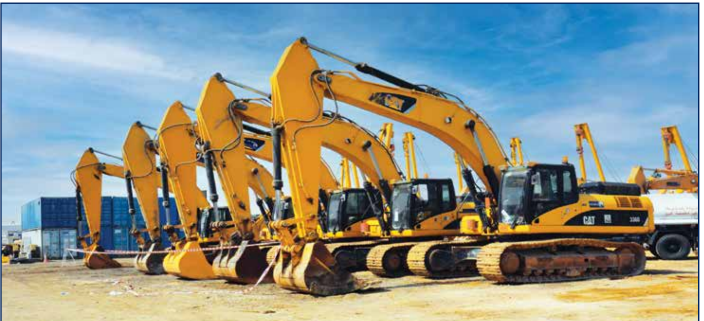
ساحة المعدات الإنشائية