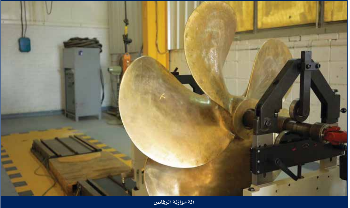
آلة موازنة الرصاص

تفخر هايسكو بقائمة إنجازاتها الطويلة والتي تشمل عملاء رئيسيين محليين وإقليميين وعالميين.