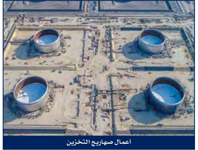
أعمال صهاريج التخزين

من خلال الخبرة الناجحة الممتدة منذ عشرات السنين في مجال تصنيع وتركيب صهاريج التخزين، فإن هايسكو مؤهلة لأعمال الهندسة والتوريد والإنشاء لصهاريج التخزين ذات القطر الكبير بما فيها الأعمال الداخلية المعقدة وأعمال الهياكل وتشمل كذلك التصاميم الداخلية والتركيب المتقن بمواقع المشاريع.