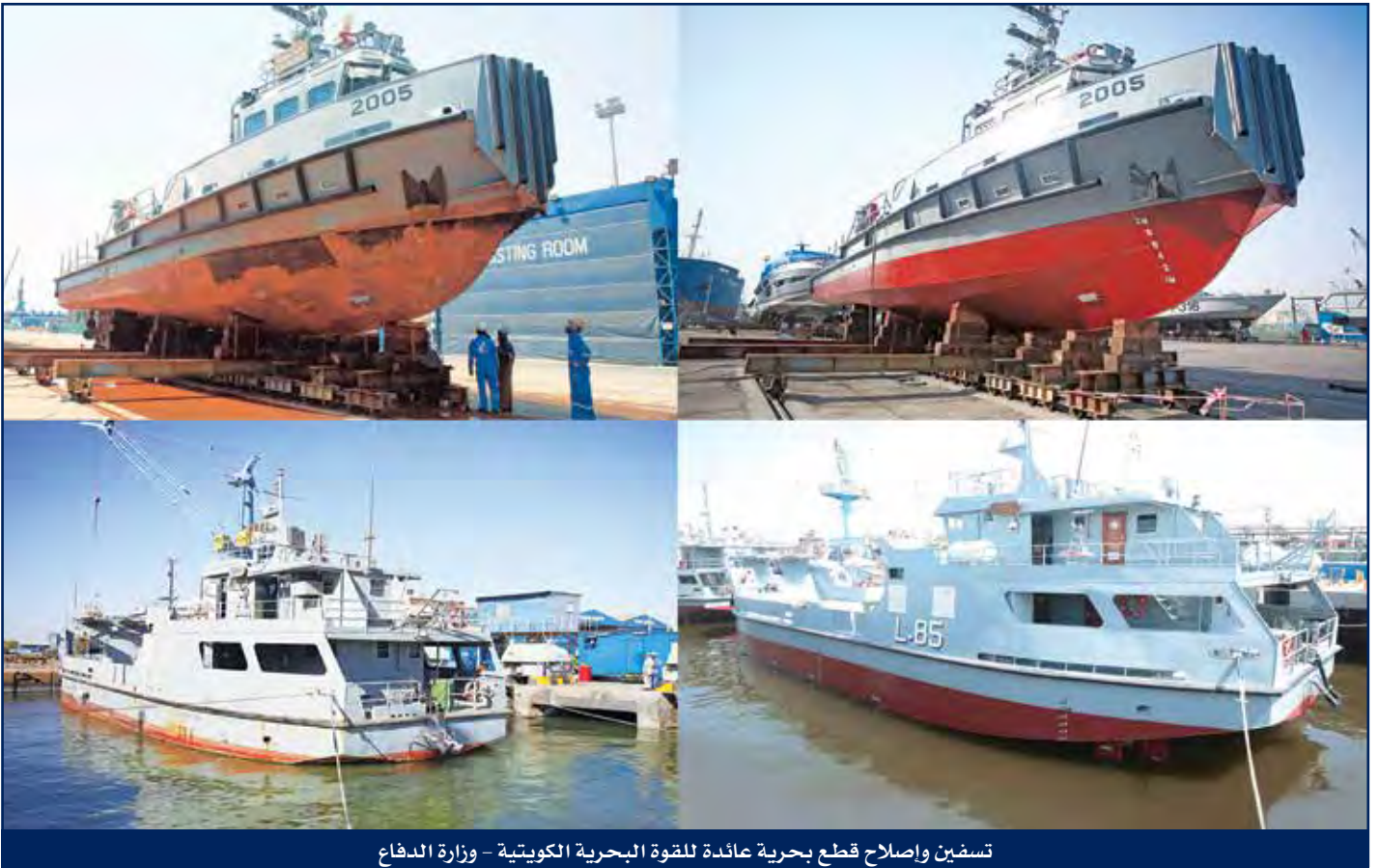
تسفين وإصلاح قطع بحرية عائمة للقوة البحرية الكويتية - وزارة الدفاع