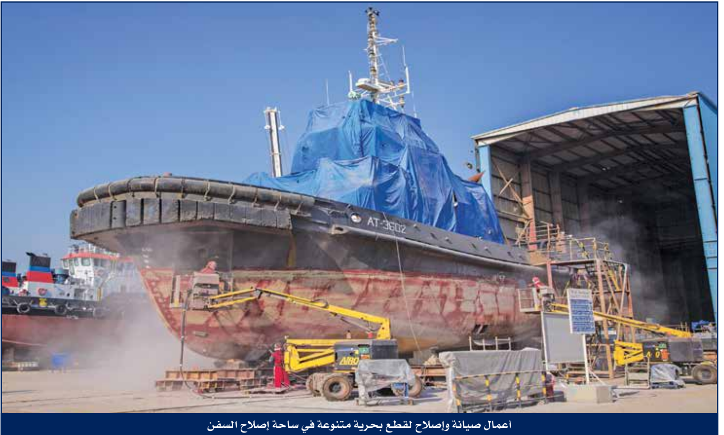
أعمال صيانة وإصلاح لقطع بحرية متنوعة في ساحة إصلاح السفن