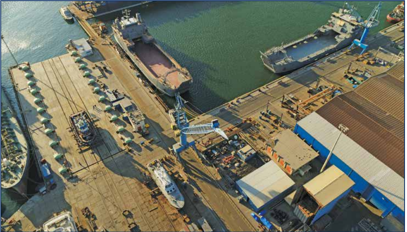
رافعة متزامنة لرفع السفن