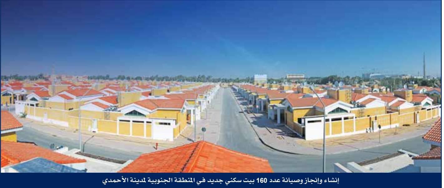
إنشاء وإنجاز وصيانة عدد 160 بيت سكني جديد في المنطقة الجنوبية لمدينة الأحمدى