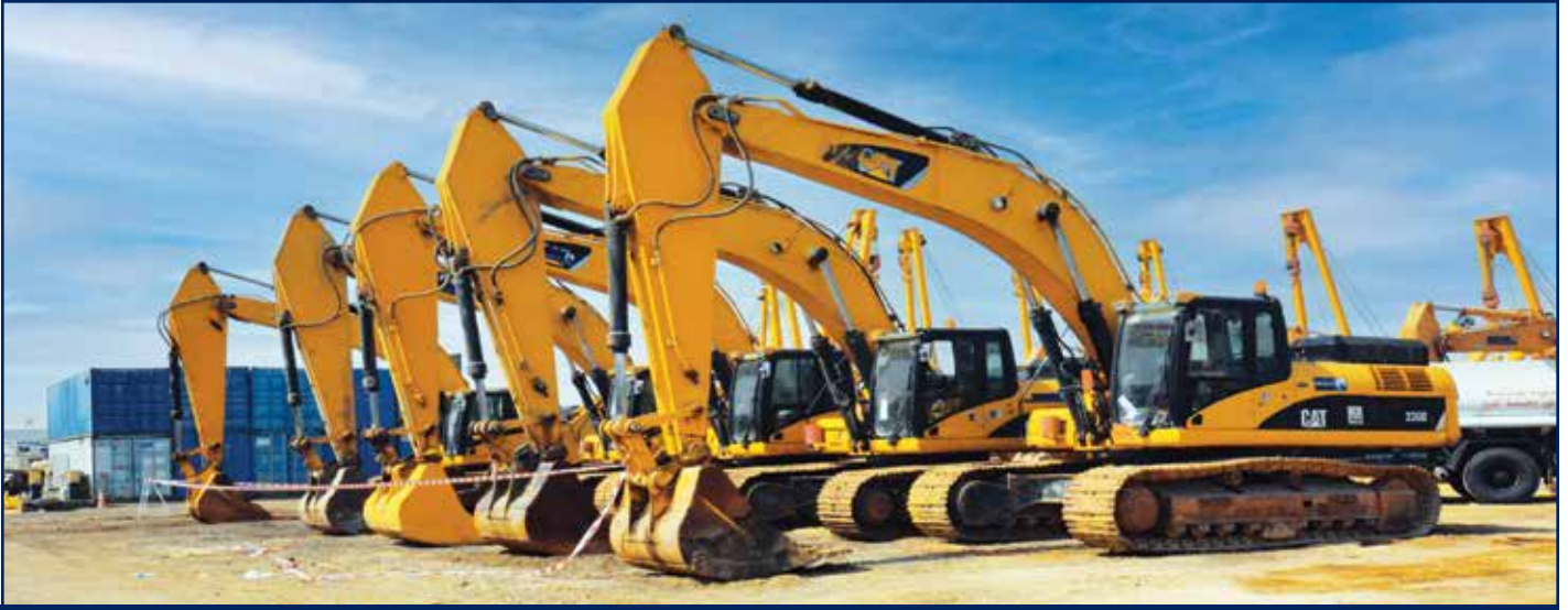
ساحة المعدات الإنشائية