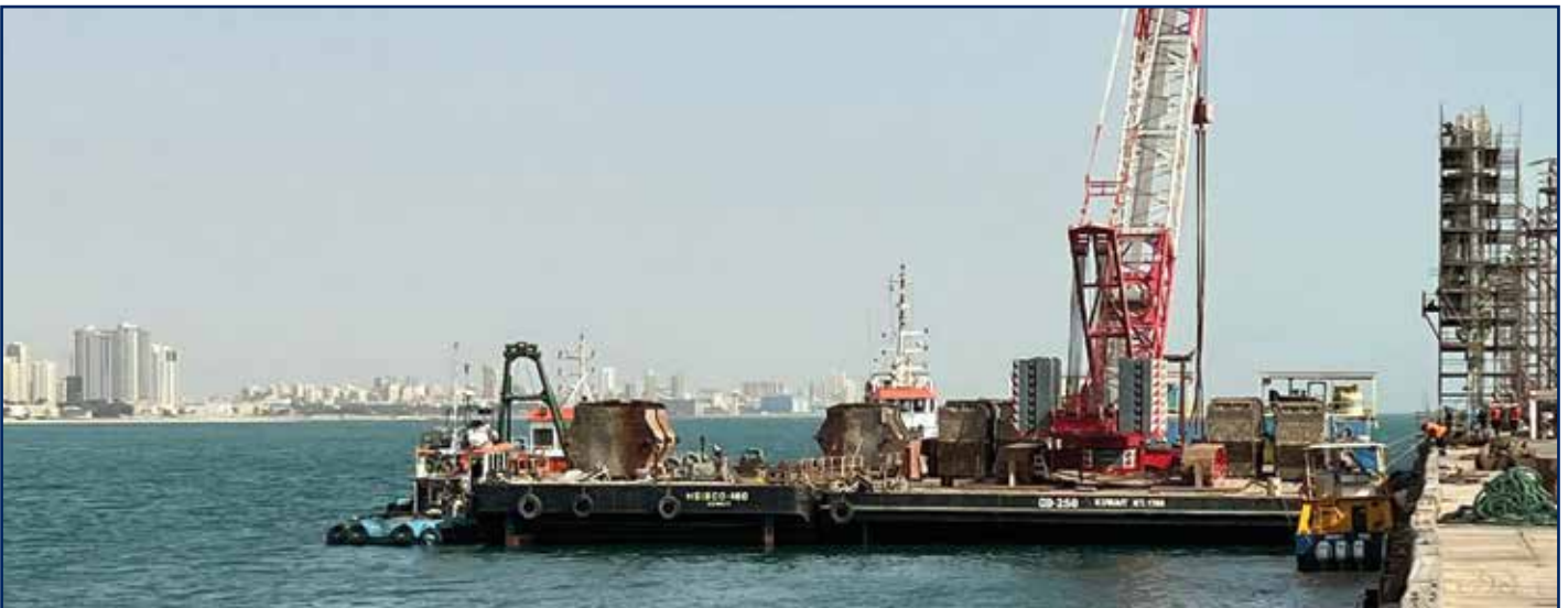
دوبة جي دي 250 تحمل معدات ثقيلة للأعمال البحرية بمصفاة ميناء الأحمدى