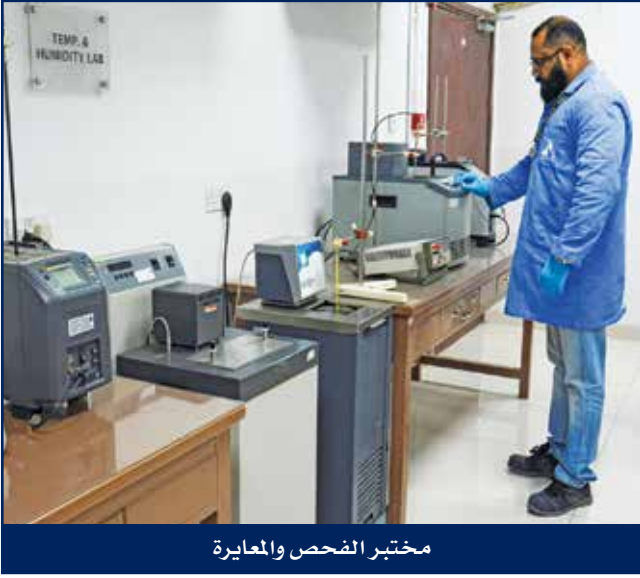
مختبر الفحص والمعايرة

أنشئ مختبر الفحص والمعايرة لدى هايسكو لتوفير خدمات المعايرة الداخلية بصفة خاصة، وتطور المختبر بشكل متسارع لتشمل خدماته أيضاً عملاء الشركة لتوفير خدمات واسعة للفحص والمعايرة في مجالات النفط والغاز والبتروكيماويات والبنية التحتية والكهربائية وقطاعات الطاقة والمياه. ومختبر الفحص والمعايرة لديه القدرة لتوفير شريحة واسعة من الخدمات المنافسة للفحص والمعايرة. ويضم المختبر فريق من المهندسين والفنيين المدربين والمؤهلين بدرجة عالية وأجهزة فحص ومعايرة متطورة ما يمنحه القدرة على توفير خدمات الفحص والمعايرة ذات الجودة والدقة العالية والجديرة بالثقة لمشاريع الشركة أو لعملائها سواء داخل المختبر أو في الموقع وكذلك توفير خدمات الفحص والمعايرة بالإستعانة بأطراف خارجية باستخدام أجهزة متخصصة إن مختبر الفحص والمعايرة معتمد وفقاً لمعايير نظام إدارة الجودة ISO 9001:2015 ومعتمد بمقياس الكفاءة الفنية في مجال المعايرة والفحص الميكانيكي وفقاً للمقياس الدولي IEC - ISO 17025 للجمعية الأمريكية لاعتماد المختبرات (A2LA).