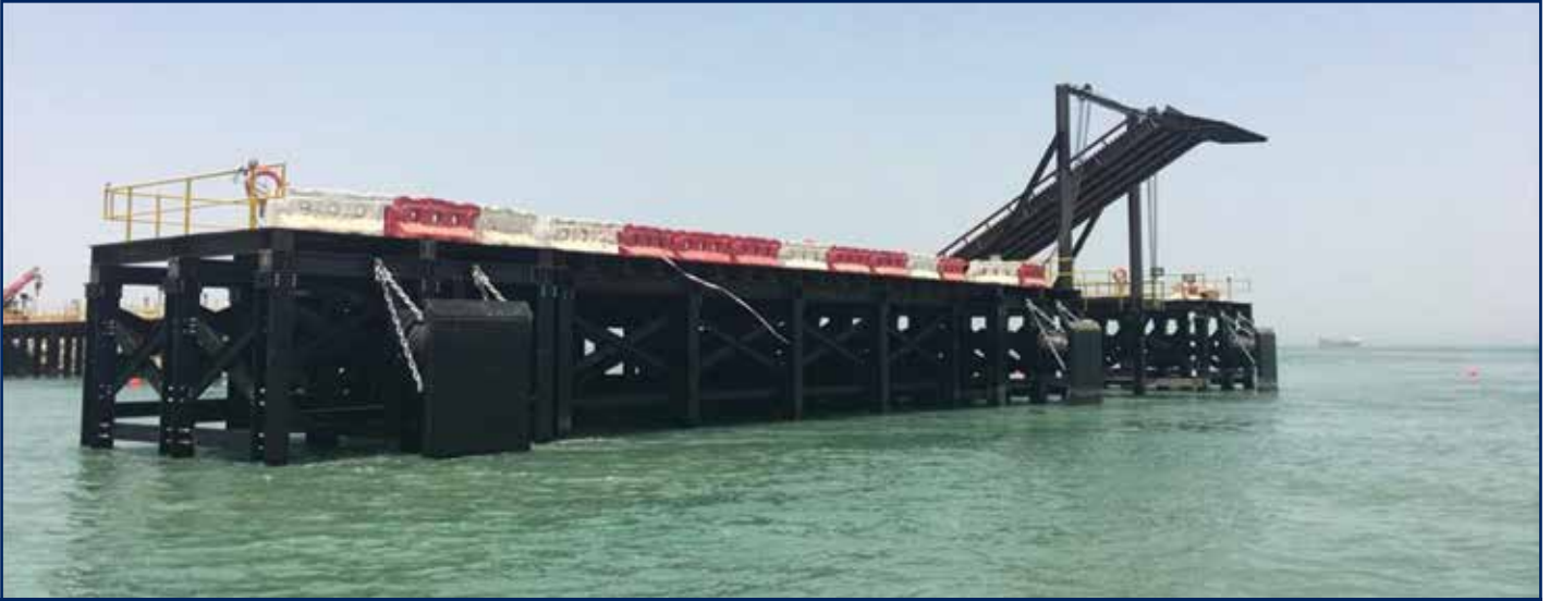
إنشاء رصيف بحري لتفريغ المواد بمرافق محطة رأس الأرض اللوجستية