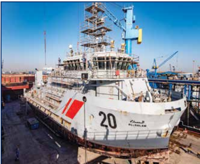
أعمال إصلاح وصيانة لقطع بحرية متنوعة على الحوض العائم

13. عقد أعمال تسفين وإصلاح للعبارتين "أم الخير" و"أبو الخير" لصالح شركة إيكاروس المتحدة للخدمات البحرية، الكويت.