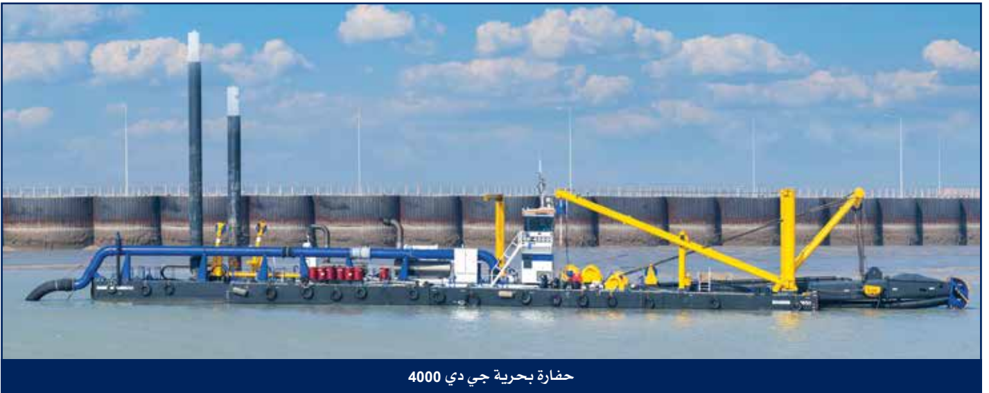
حفارة بحرية جي دي 4000

تأسست شركة الخليج للإنشاءات والأعمال البحرية والمقاولات العامة ش.م.ك (مقفلة) في عام 1975 مشاركة بين حكومة دولة الكويت وشركة بالاس ت نيدام الهولندية، لتلبية المتطلبات المتزايدة على أعمال الحفر والتعميق البحري سواء داخل أو خارج دولة الكويت. إذ بدأت الشركة آنذاك أعمال الحفر البحري من خلال أسطول من الحفارات البحرية ذات القطع والشفط، وجرافة بحرية ومعدات مصاحبة، وقد تركزت أعمال الشركة في مشاريع الحفر الكبرى في الكويت. في عام 1980 توسعت أنشطة الشركة لتشمل أنشطة أخرى في مجال المقاولات والإنشاءات البحرية.