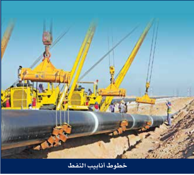
خطوط أنابيب النفط

تفخر هايسكو بما لديها من خبرة واسعة في مجال الهندسة والتوريدات والإنشاءات بمشاريع خطوط الأنابيب في الكويت، وأن التزامها بقواعد السلامة يعد ركن أساسي. ولديها الخبرة في إنشاءات خطوط الأنابيب كبيرة القطر وإنشاء خطوط الأنابيب الطويلة.