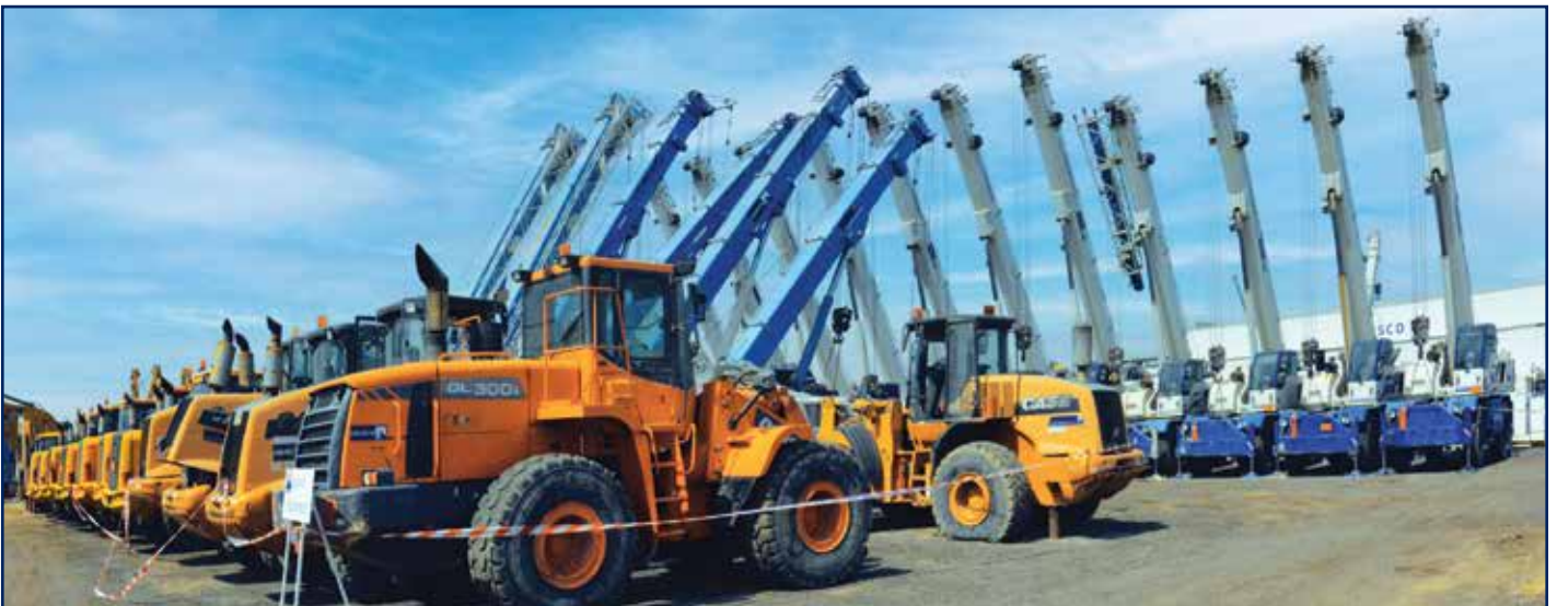
ساحة المعدات الإنشائية