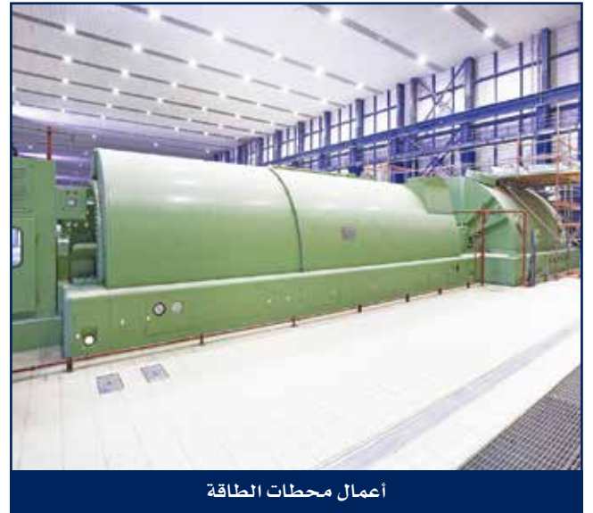
أعمال محطات الطاقة

من خلال الخبرة الكبيرة في تشغيل وصيانة محطات الطاقة وتوفر أسطول متنوع من المعدات تقوم هايسكو بإنجاز كافة أعمال الصيانة لمحطات الطاقة في موقعها، وتشمل هذه العمليات على خدمات متنوعة مثل عمليات الإغلاق الرئيسية للسخانات وعمليات التنظيف الكيميائي وإعادة إعمار التوربينات البخارية والغازية وتحسين أداء الإحتراق للسخانات، وتوفير الخدمات الميكانيكية والكهربائية والأجهزة الدقيقة وأجهزة التحكم وصيانة وحدات تقطير المياه ومحطات إعادة الكربنة، ومحطات ضخ الوقود