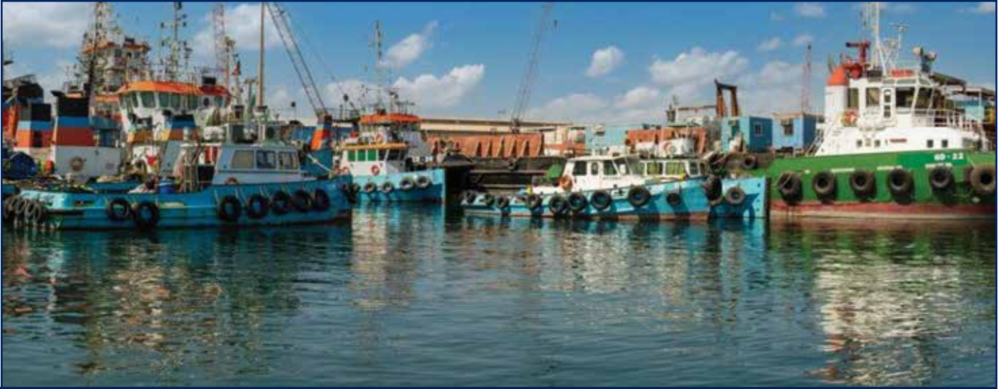
منطقة رسو القطع البحرية بميناء الشويخ