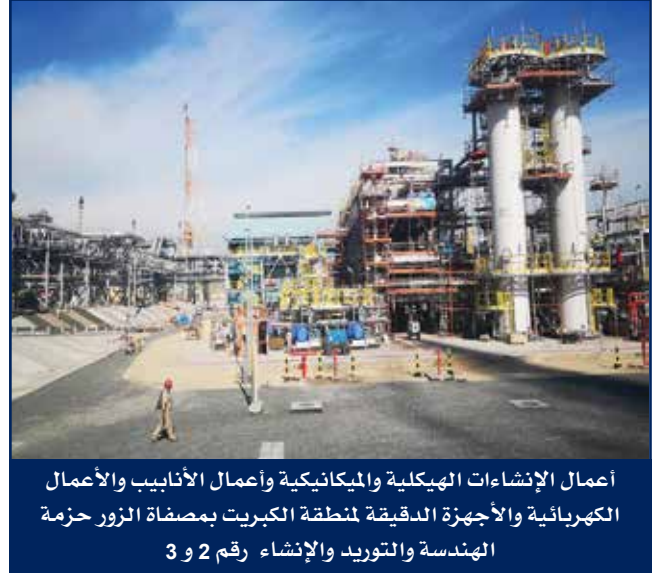
أعمال الإنشاءات الهيكلية والميكانيكية وأعمال الأنابيب والأعمال الكهربائية والأجهزة الدقيقة لمنطقة الكبريت بمصفاة الزور حزمة الهندسة والتوريد والإنشاء رقم 2 و 3