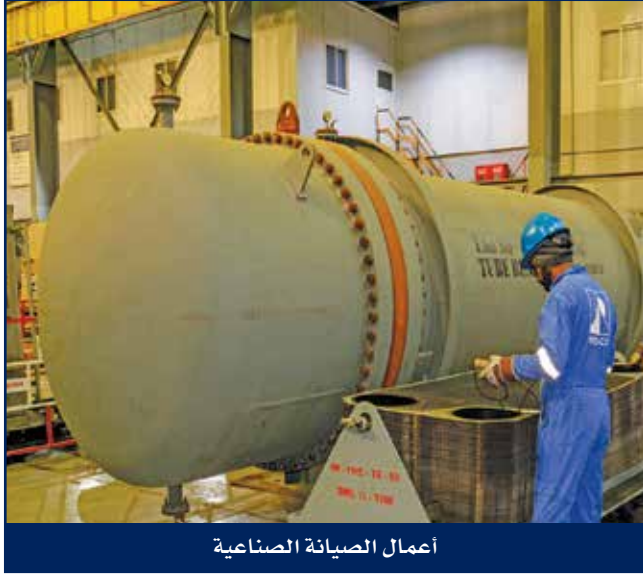
أعمال الصيانة الصناعية

عمليات الصيانة الصناعية لدى هايسكو معروفة كمتعهد رئيسي لتقديم الخدمات ذات القيمة المضافة للعملاء الأساسيين كوزارة الكهرباء والماء والطاقة المتجددة وشركة نفط الكويت وشركة البترول الوطنية الكويتية والشركة الكويتية لنفط الخليج وشركة صناعة البتروكيماويات وشركة إيكويت والعمليات المشتركة، وقد اكتسب فريق عمل الصيانة الصناعية خبرة طويلة ومهارات واحترافية عالية في تقديم الخدمات الصناعية المتكاملة وتوفير الدعم والحلول الفنية ذات المقاييس العالية في الجودة والسلامة بأسلوب التكلفة الفعالة.