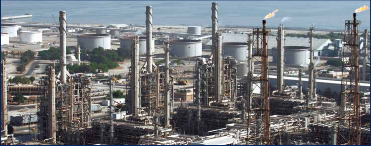
قطاع النفط والغاز