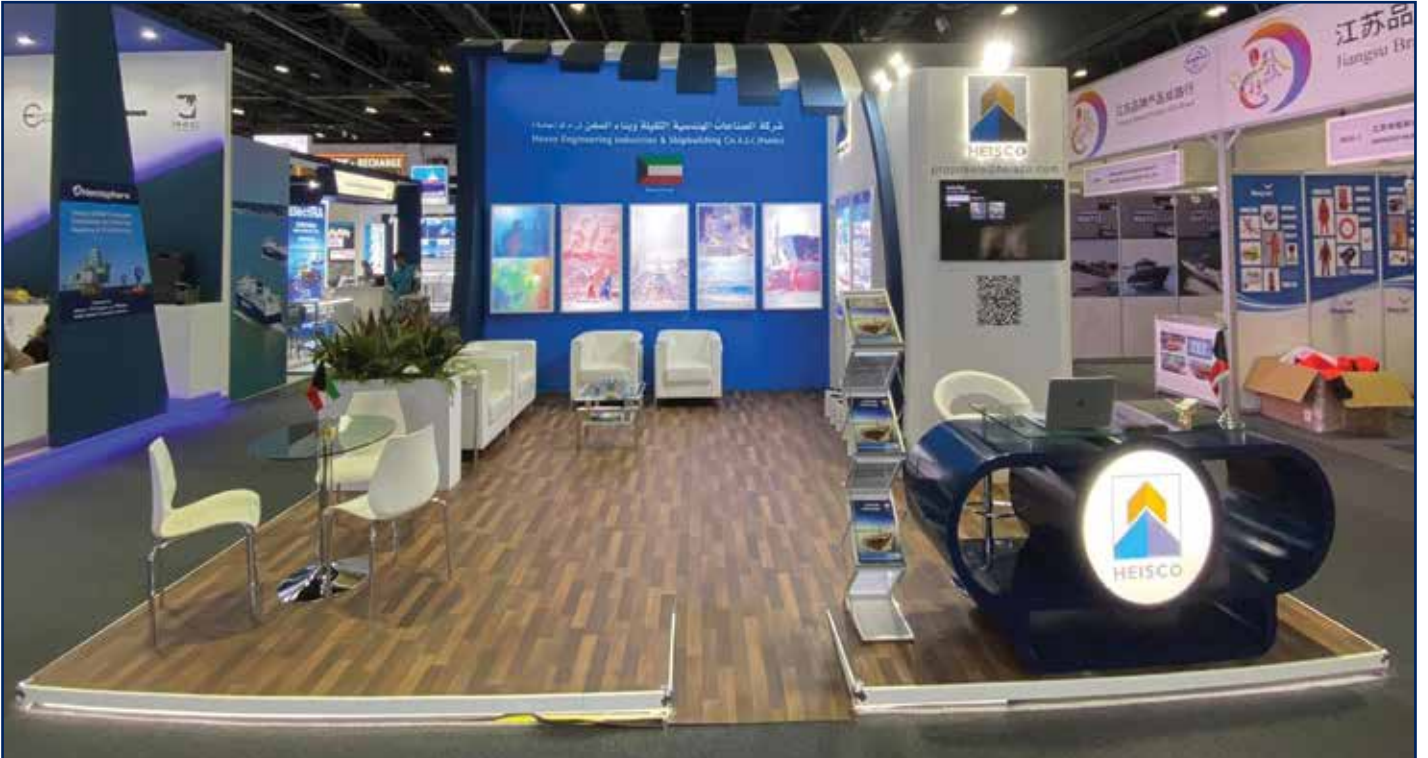
جناح هايسكو في معرض التجارة البحرية للملاحة واللوجستيات للشرق الأوسط المقام في الفترة ما بين 16 - 18 مايو عام 2023 في مركز التجارة العالمي، دبي (الإمارات العربية المتحدة)