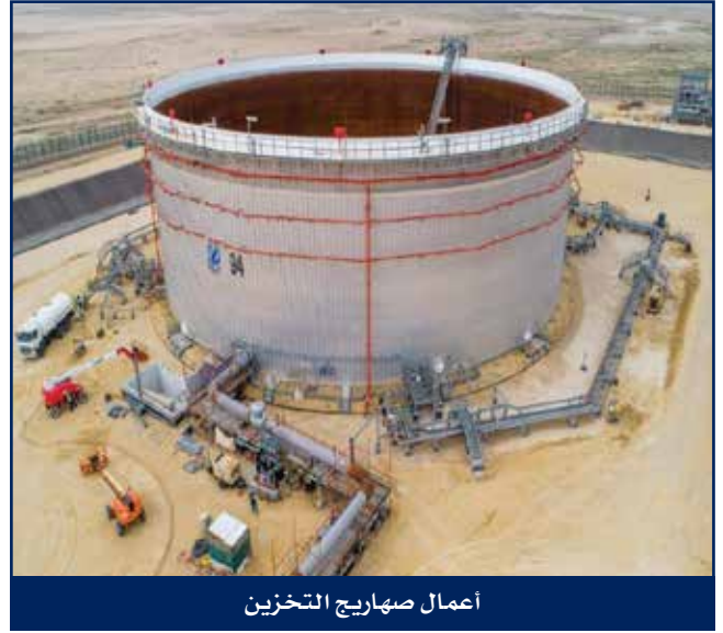
أعمال صهاريج التخزين

من خلال الخبرة الناجحة الممتدة منذ عشرات السنين في مجال تصنيع وتركيب صهاريج التخزين، فإن هايسكو مؤهلة لأعمال الهندسة والتوريد والإنشاء لصهاريج التخزين ذات القطر الكبير بما فيها الأعمال الداخلية المعقدة وأعمال الهياكل وتشمل كذلك التصاميم الداخلية والتركيب المتقن بمواقع المشاريع.