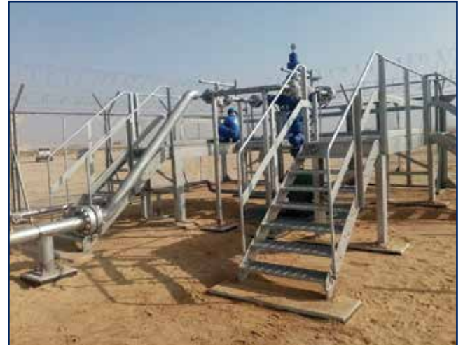
أعمال إنشاء خطوط التدفق والأعمال المرتبطة بها في منطقة غرب الكويت 2

1. عقد خدمات الصيانة الميكانيكية الإنشائية الموقعية لصالح شركة إيكويت للبتروكيماويات.