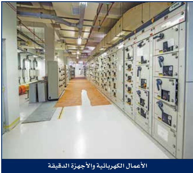
الأعمال الكهربائية والأجهزة الدقيقة

تعد هايسكو رائدة في مجال الأعمال الكهربائية والأجهزة الدقيقة وخدمات الاتصالات، وتقدم حلول تخصصية ذات نطاق واسع في هذا المجال، ويتعدى ذلك تقديم خدمات عديدة تغطيها الشركة بما فيها الخدمات الهندسية والإنشائية وخدمات المعايرة وأعمال الحماية الكاثودية وخدمات الفحص والتركيبات والتشغيل والصيانة وخلافه... وتقدم هايسكو هذه الخدمات إلى قطاعات حساسة كقطاع إنشاءات النفط والغاز والتشغيل والصيانة ومشاريع الإنشاءات البحرية والقوى الكهربائية، وتتكفل الشركة بتنفيذ وإنجاز كافة ما تقدمه من خدمات بأداء متميز.