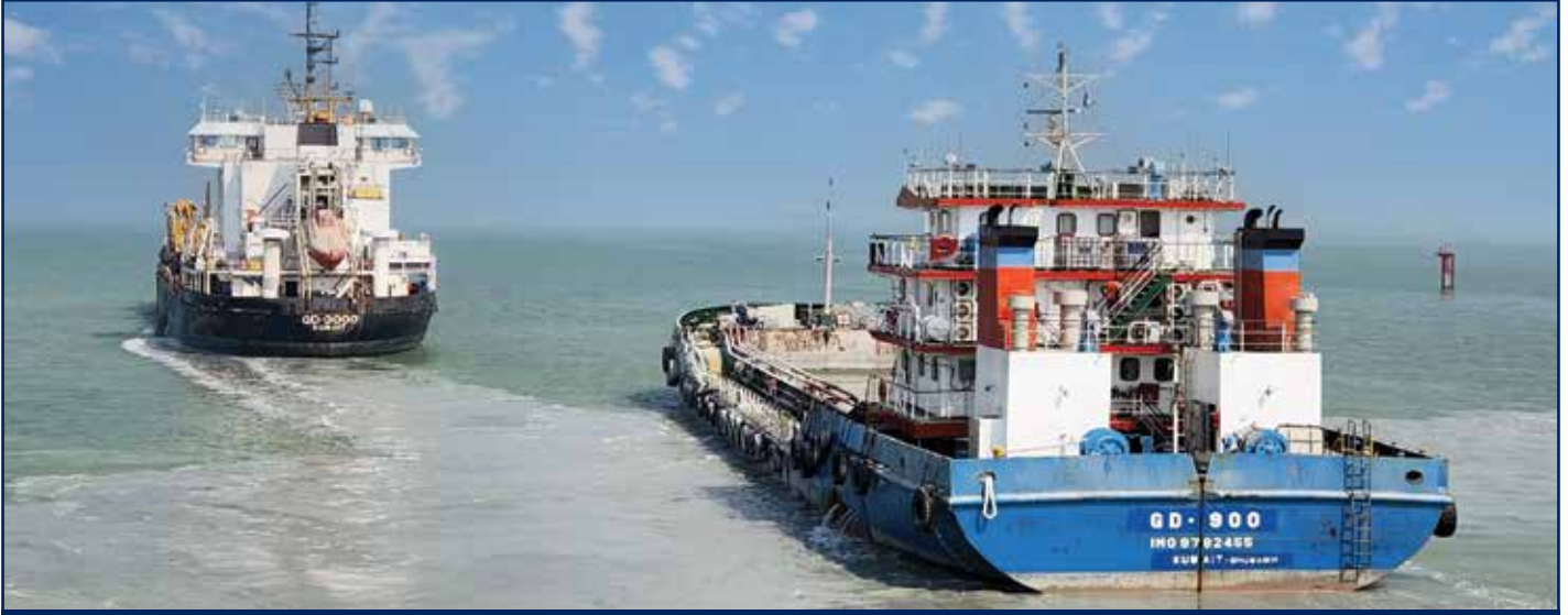
أعمال تطهير وتنظيف القناة الملاحية وأحواض الأرصفة بميناء الشويخ