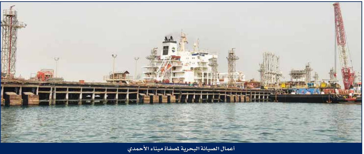
أعمال الصيانة البحرية لمصفاة ميناء الأحمدى