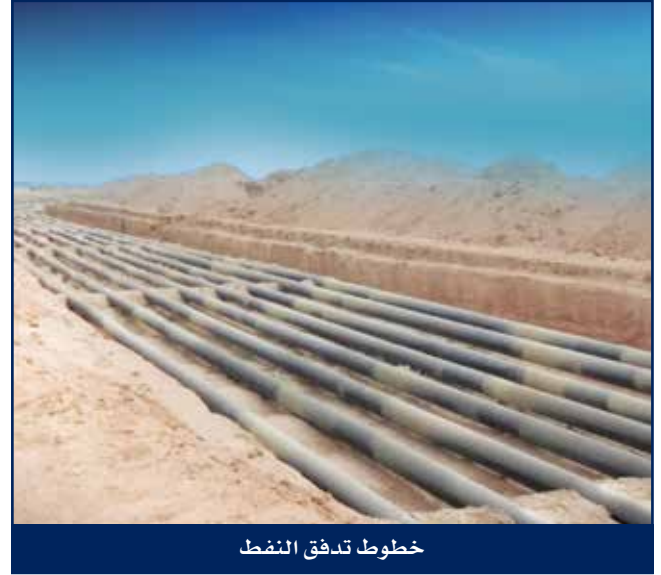
خطوط تدفق النفط

تقوم هايسكو بتنفيذ أعمال المسح الميداني وفحص خواص الموقع وتركيب خطوط التدفق وتشغيلها، وتقوم بأعمال التخطيط والتوريدات وتوفير المواد والإشراف والتصنيع والفحص والاختبار لخطوط التدفق وأنابيب الفولاذ الكربوني وأنابيب البلاستيك المقوى حرارياً ووصلات الرؤوس والمشعبات، وإنشاء المشعبات البعيدة الجديدة وكافة الأعمال المدنية المصاحبة لها.