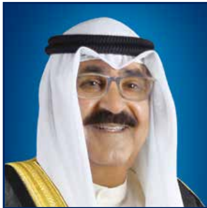
صاحب السمو أمير دولة الكويت الشيخ/مشعل الأحمد الجابر الصباح