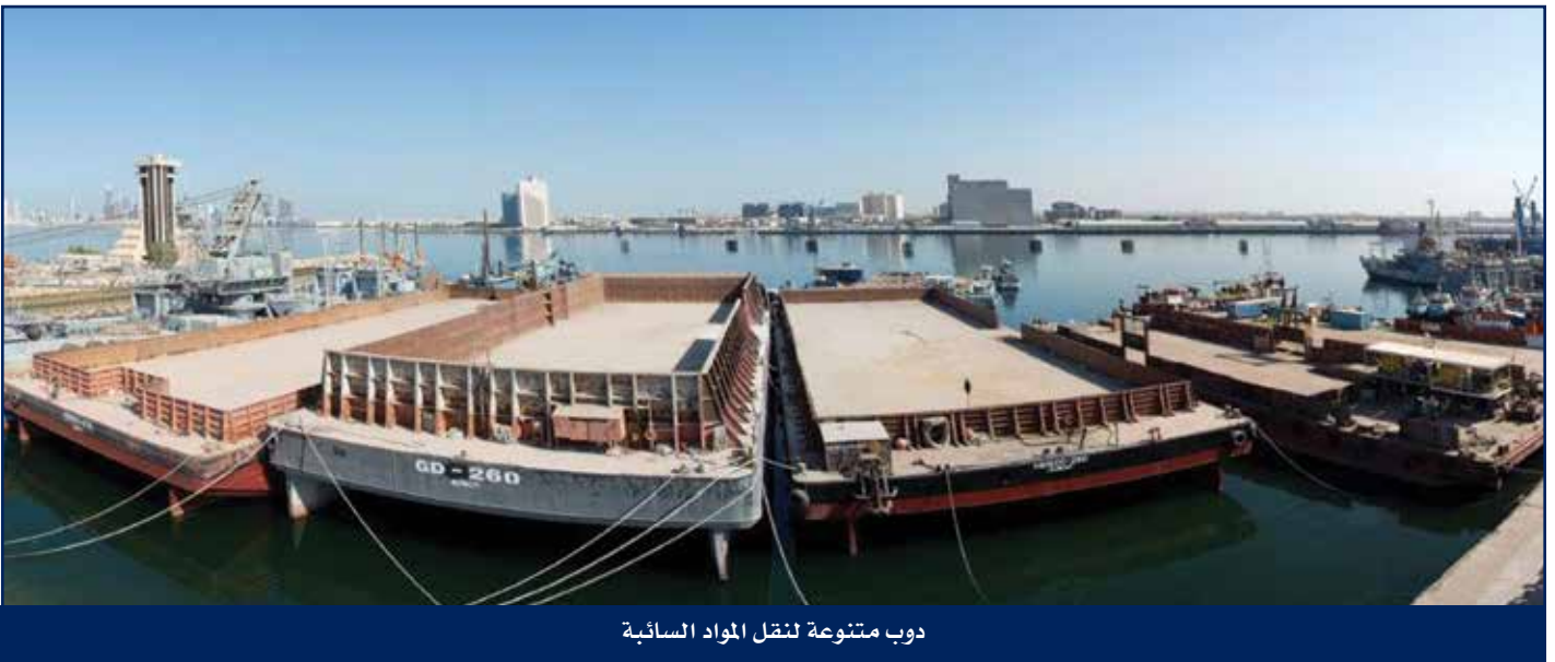
دوب متنوعة لنقل المواد السائبة