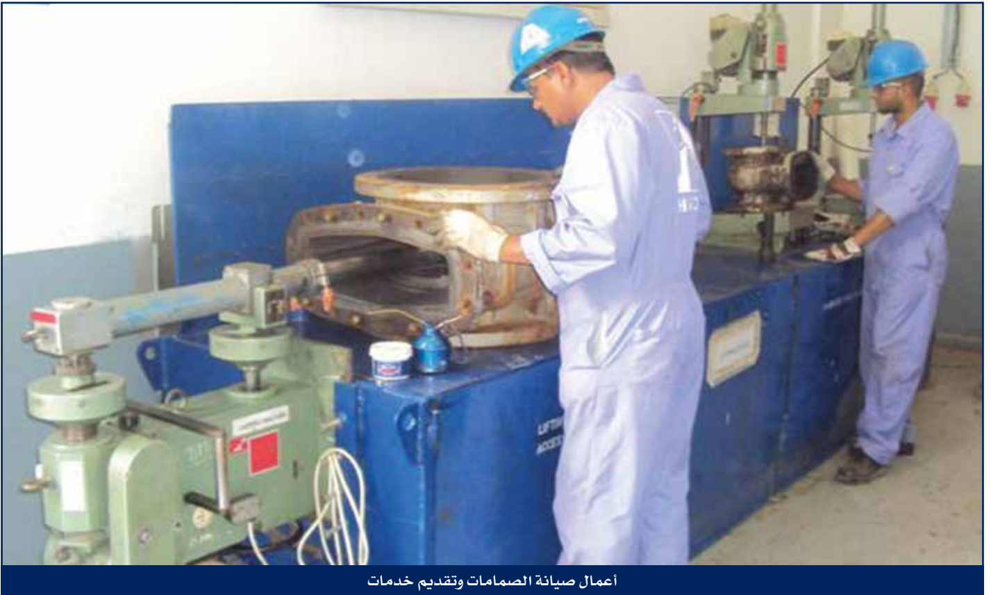
أعمال صيانة الصمامات وتقديم خدمات