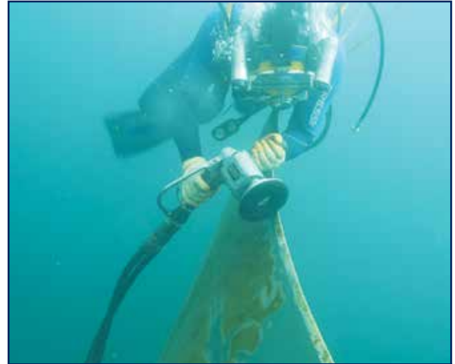
أعمال تنظيف وتلميع ورفاص الدفع للسفينة

وزارة الكهرباء والماء والطاقة المتجددة. أعمال تسفين وصيانة قوارب الخدمات التابعة لشركة ناقلات النفط الكويتية.