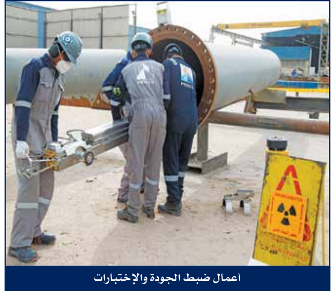
أعمال ضبط الجودة والإختبارات

تولي الإدارة العليا لهايسكو جُل اهتمامها لتقديم خدمات ذات جودة عالية لعملائها، عملت الشركة بقوة على تطوير وتفعيل نظام إدارة الجودة لديها لضمان ترسيخ أفضل ممارسات العمل وصولاً إلى توقعات العميل، ومن شأن هذا النظام أن يرتقي بكافة إدارات الشركة بعملياتها المتنوعة، إن نظام إدارة الجودة للشركة معتمد ليتوافق مع المقياس العالمي ISO 9001:2015