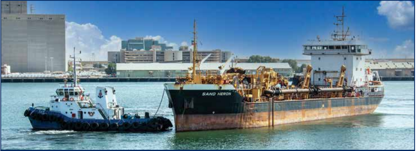
حفارة بحرية جي دي 3000