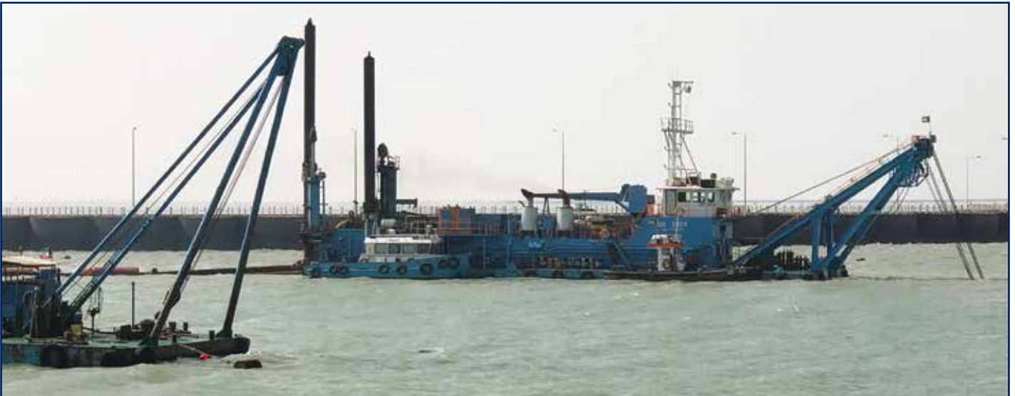
أعمال تطهير قناة مأخذ مياه البحر لمحطة الصبية لتوليد القوى الكهربائية وتقطير المياه