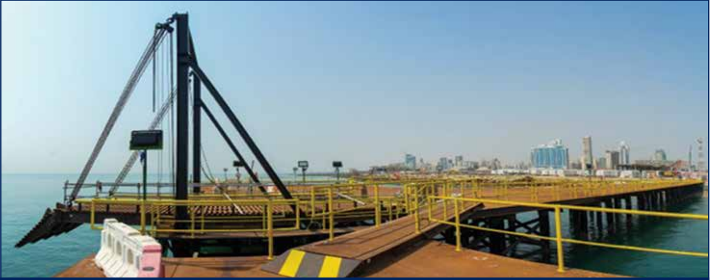
تصميم وإنشاء المرافق الساحلية لمحطة رأس الأرض اللوجستية