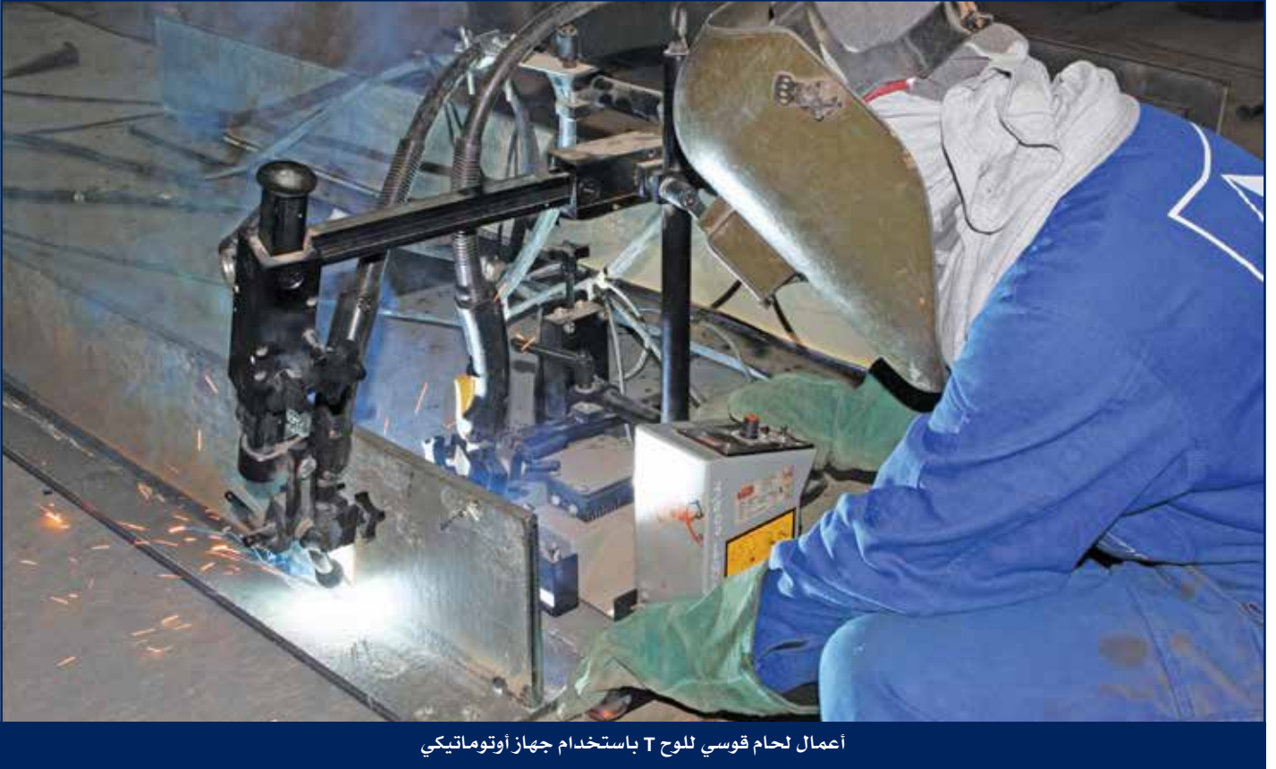
أعمال لحام قوسي للوح T باستخدام جهاز أوتوماتيكي